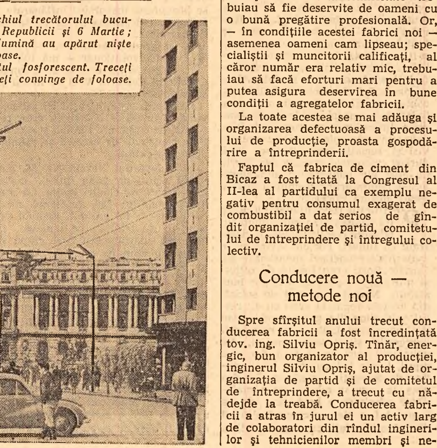
Se instalează luminatul fosforescent. Treceți seara pe acolo și vă veți convinge de foloase.