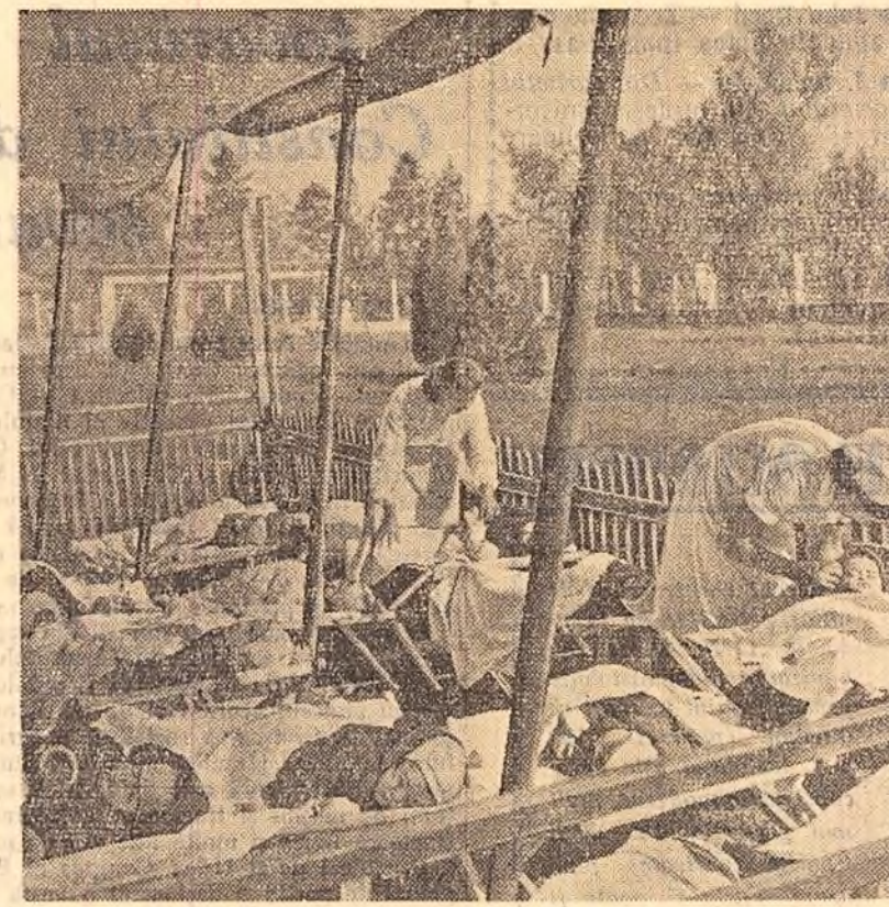
Profitind de ultimele zile însoțite din toamna aceasta, copiii din creșea fabricii de confecții „Gh. Gheorghiu-Dej” sînt scoși în pătuțurile lor la soare.