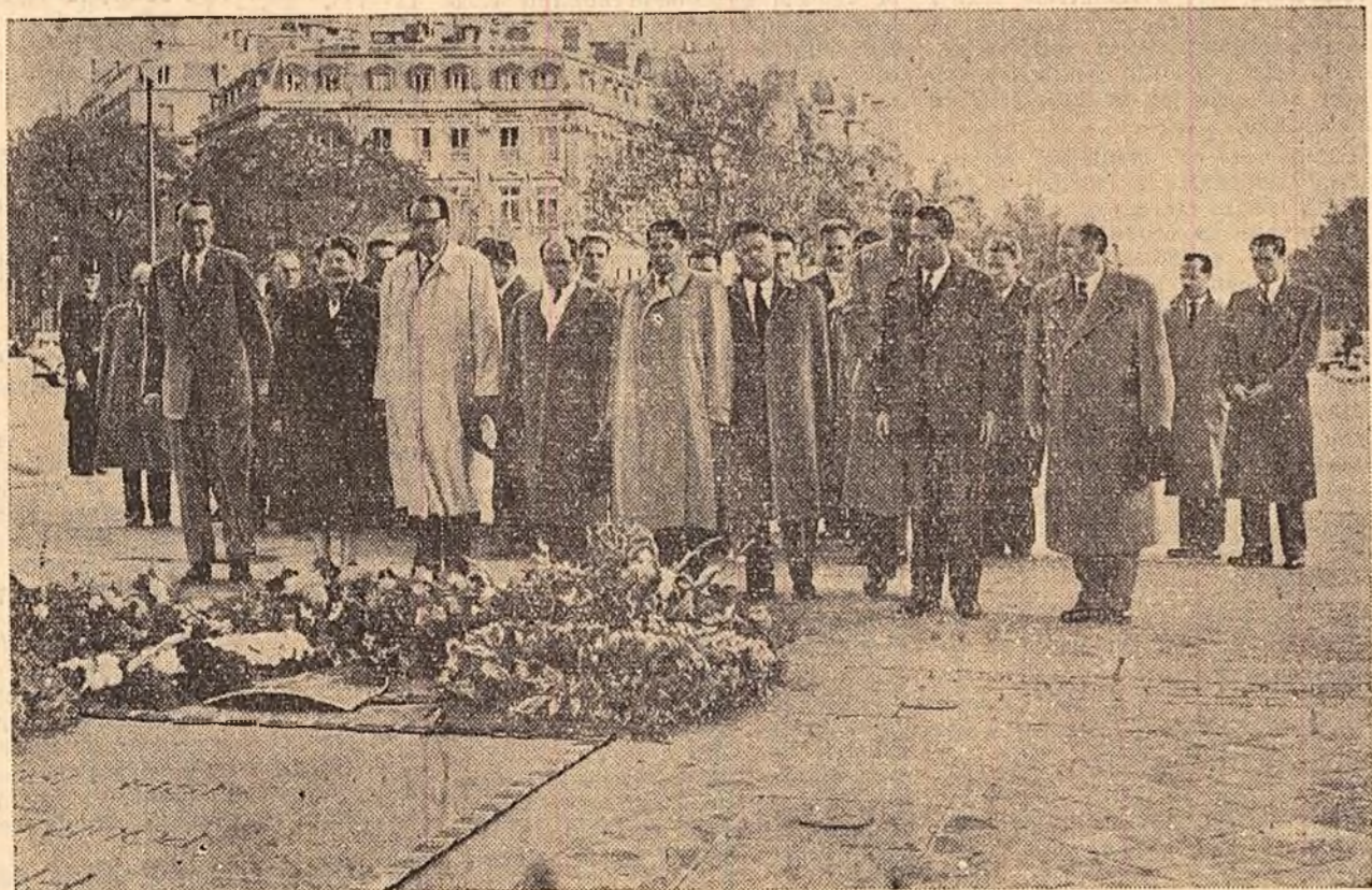
Un aspect din cursul vizitei făcute în Franța de delegația parlamentară romină: depunerea unei coroane la mormîntul Sfatului necunoscut, la Arcul de Triumf.