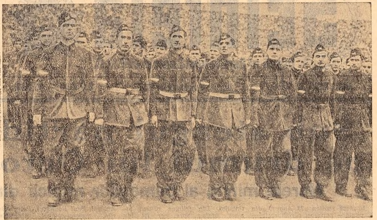
Trec gările muncitorești

Tovarăși, Intelectualii din R.P. Romîniă sînt pe deplin conșinși, la fel cu muncitorii din fabrici și de pe ogoare, că, dacă ei izbutesc să realizeze opere de valoare, lucru recunoscut și peste hotare, și să contribuie astfel la construirea socialismului în patria lor dragă, faptul se doarește marelui eveniment de însemnătate istorică mondială pe care-l sărbătorește astăzi omenirea cîntînd din lumea întreagă. Fără lupta clasei muncitoare ruse, condusă de glorioșul partid bolșevic în frunte cu V. I. Lenin, intelectualii romîni ar fi continuat să îndure asuprirea regimului nefast din trecut sau să se pună în slujba lui și să participe astăzi, cel puțin indirect, la exploatarea claselor muncitoare în folosul burgheziei și al moșierimii. Sub îndrumarea P.M.R., oamenii de știință și de cultură din R. P. Romîniă își vor închina și de acum înainte talentul și forța lor creatoare de-