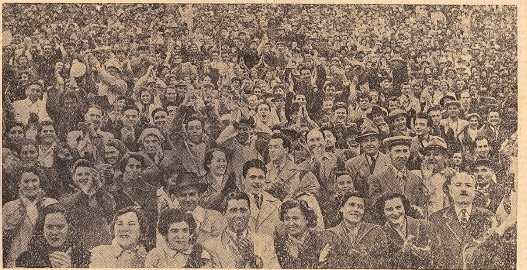
Participanții la mitingul din Capitală aclamă cu entuziasm apariția în tribuna oficială a conducătorilor partidului și guvernului

De asemenea, în Piața Roșie au fost prezentate rachete care nu cu-