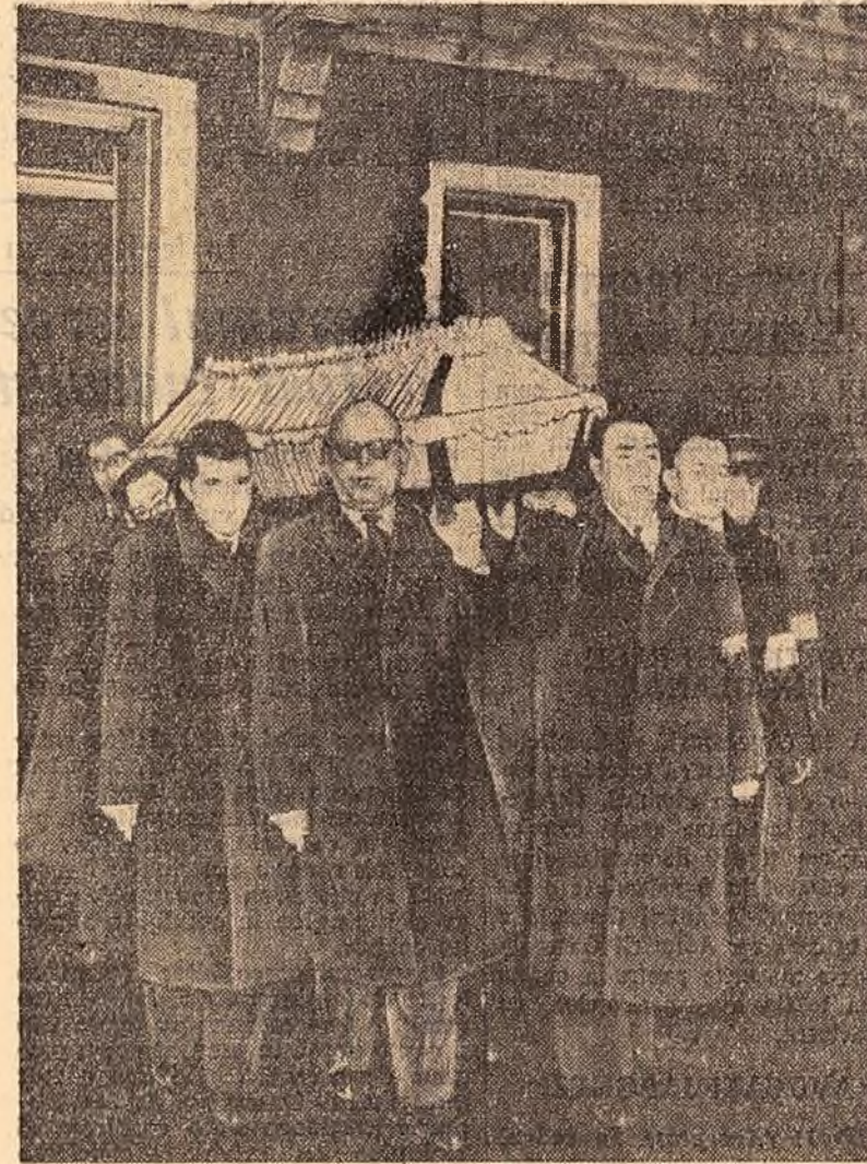
Scriul cu corpul neînșulețit al tovarășului Grigore Preoteasa, purtat pe umeri la ieșirea din Casa Sindicatelor din Moscova.

tru prietenia și colaborarea dintre popoarele romin și sovietic, dintre popoarele tuturor țărilor socialiste, a luptat neabătut pentru menținerea păcii în lumea întreagă. Poporul romin, pășind pe calea socialismului a obținut, sub conducerea Partidului Muncitoresc Român, mari succese în toate domeniile construcției politice, economice și culturale. La obținerea acestor succese a adus o mare contribuție, prin intensă sa activitate, prietenul și tovarășul nostru de neuitat, Grigore Preoteasa. Oameneii muncii din țara noastră vor întări și pe viitor neabătut relațiile prietenești dintre popoarele Uniunii Sovietice și României. Popoarele țărilor noastre vor lupta împreună pentru cauza construirii socialismului și comunismului, careia i-a slujit neobosit, pînă în ultimele zile ale vieții sale, Grigore Preoteasa. Oameneii sovietici vor păstra pentru todeauna amintirea luminoasă a tovarășului Preoteasa, lui devotați al poporului român. Ne luăm rămas bun de la tine, dragul nostru prieten și tovarăș!