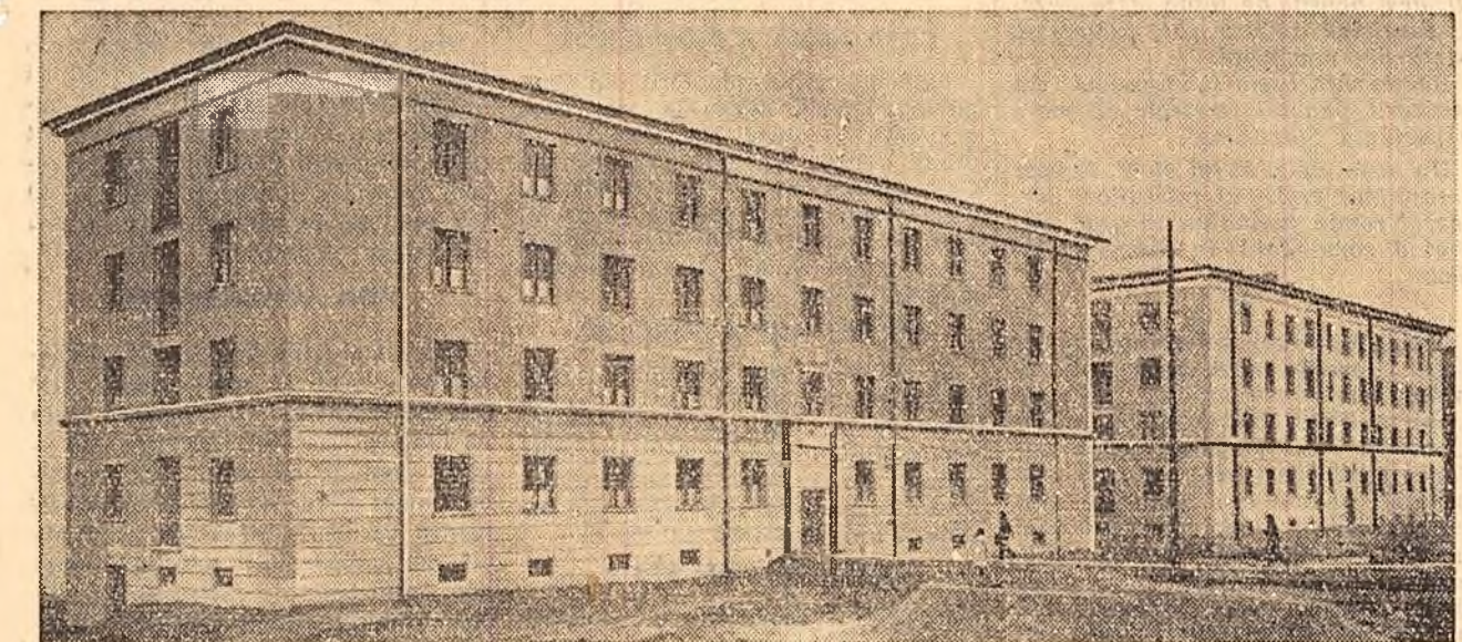
Înainte de 23 August 1944 studenții ieșeni aveau doar cîteva cămine improvizate, în care nu erau cuprinși decât foarte puțini studenți. În anii regimului democrat-popular s-a construit un institut modern pentru studenții de la Agronomie precum și 3 blocuri de cămine studențești cu o capacitate de 300-450 locuri fiecare. În clișeu: Căminele noi ale Institutului Agronomic.