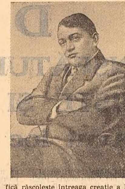
Fică răscoleyte întreaga creație a lui Ady. Simbolurile indeplinește, la acest poet, o funcție opusă celei care o are în cea mai mare parte a scrierilor simbolizării occidentale.

Se împlinesc astăzi optzeci de ani de la nașterea lui Ady Endre, unul din cei mai mari poeți maghiari, poet prin opera căruia poporul frate aduce una din contribuțiile sale de seamă la îmbogățirea tezaurului literaturii mondiale.