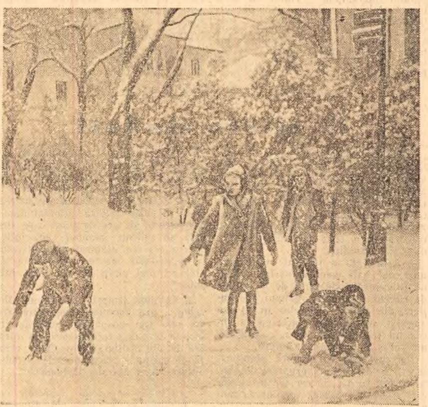
„A-nceput de ieri să cadă cite-un fulg...”

Cu ocazia sărbătorii „Lunii culturii” și a celei de-a 10-a aniversări a Republicii Populare Romine, Muzeul de artă populară din București va deschide la 3 decembrie o expoziție de artă populară a naționalităților conlocuitoare din țara noastră. În acest scop au fost rezervate două săli unde vor fi expuse peste 1000 obiecte din ceramică, lemn, țesături etc. Pentru o prezentare cit mai completă a obiectelor artă de varietate și de pitorești au fost făcute importante achiziții de costume, podoabe, interioare țărănești și altele. Fiecare minoritate națională de pe teritoriul țării noastre va fi reprezentată la expoziție pe zone etnografice.