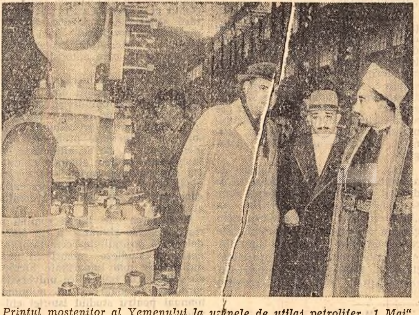
Prințul mostenitor al Yemenuului la uzinele de utilaj petrolifer „1 Mai” din Ploesti În pag. III-a: Recepția în cinstea prințului mostenitor al Yemenuului; Înălți demnitari yemeniți — la Ploesti.