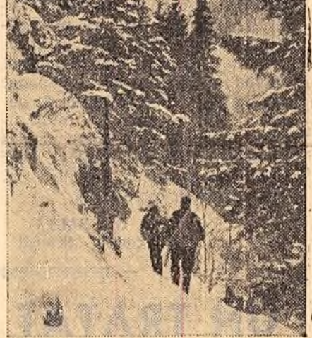
Căderea zăpezii sporește farmecul văilor și înălțimilor Făgărașului. Frumusețile, atât de prețuite de turiști, sînt căutate din nou. În clișeu: Doi drumuri îndrăgite de excursioniști în drum spre cabana Bile-Lac.

Vizitind oricare șchedă, întreprindere sau trust din industria petroliferă sau chimică vei afla același lucru: numărul inovațiilor și raționalizărilor aplicate a crescut de la an la an. Din 1951 și pînă în prezent numărul inovațiilor și raționalizărilor aplicate în cadrul Ministerului Petrolului și Chimiei se ridică la peste 20.000, obținîndu-se economii pe întregul sector de circa 60.000.000 lei. Suma acordată drept recompensă inovatorilor și raționalizatorilor din sector în această perioadă întrece 15.000.000 lei.