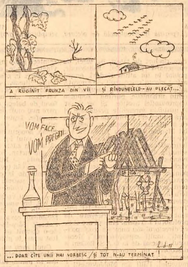
DOAR CITE UNII MAI VORBESIC SI TOT N-AU TERMINAT! Desen de L. DARIAN