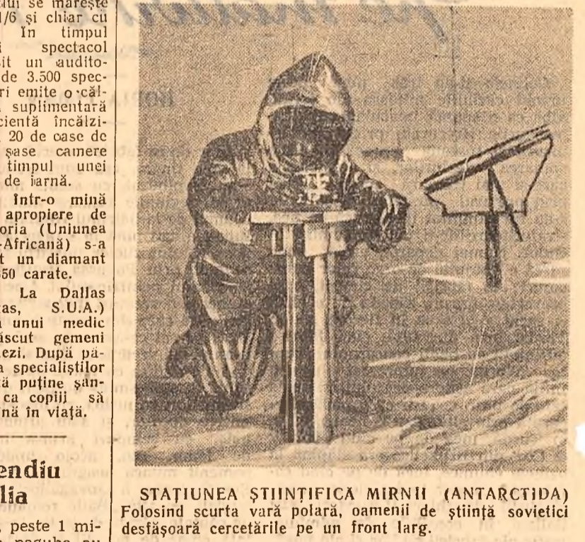
STAȚIUNEA ȘTIINȚIFICĂ MIRNII (ANTARCTIDA) Folosind scurta vară polară, oamenii de știință sovietici desășoară cercetările pe un front larg.

Această operație a fost efectuată de helicoptel în cinci zboruri în decurs de două ore, în timp ce, folosind o macara, pentru a efectua operație ar fi fost necesare cel puțin două săptămîni.