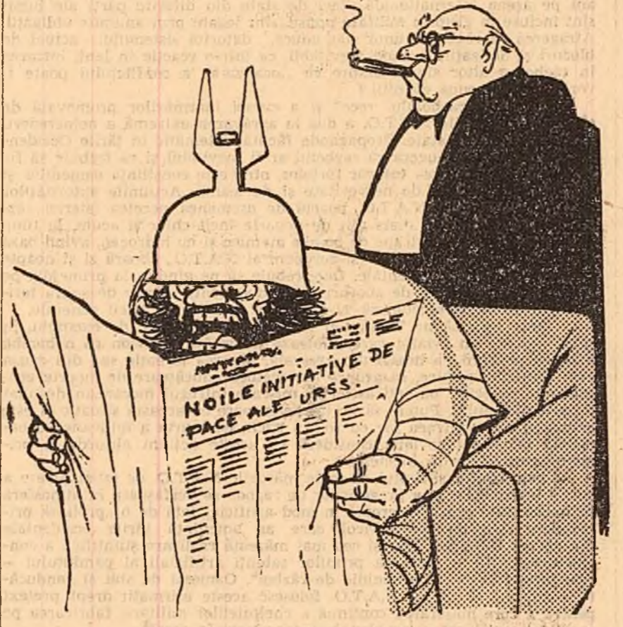
RAZBOIUL RECE: — Simt că încep să mă sufoc (Desen de CIK DAMADIAN)

DJAKARTA 13 (Agerpres). — China Nouă. La 12 decembrie a luat ființă la Djakarta o organizație care are drept scop întărirea colaborării dintre muncitorii și militarii indonezieni. Ședința de constituire a organizației a fost prezidată de Nasution, șeful statului major al armatei indoneziane.