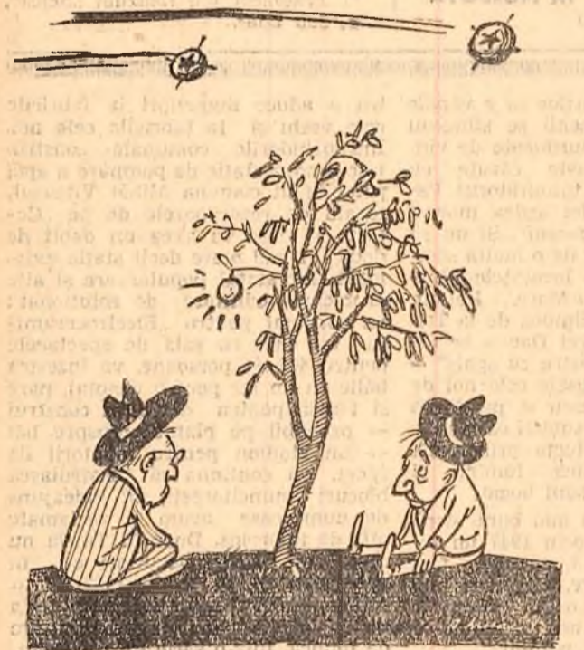
Așteptăm să ni se coacă satelitul Desen de A. LUCACI