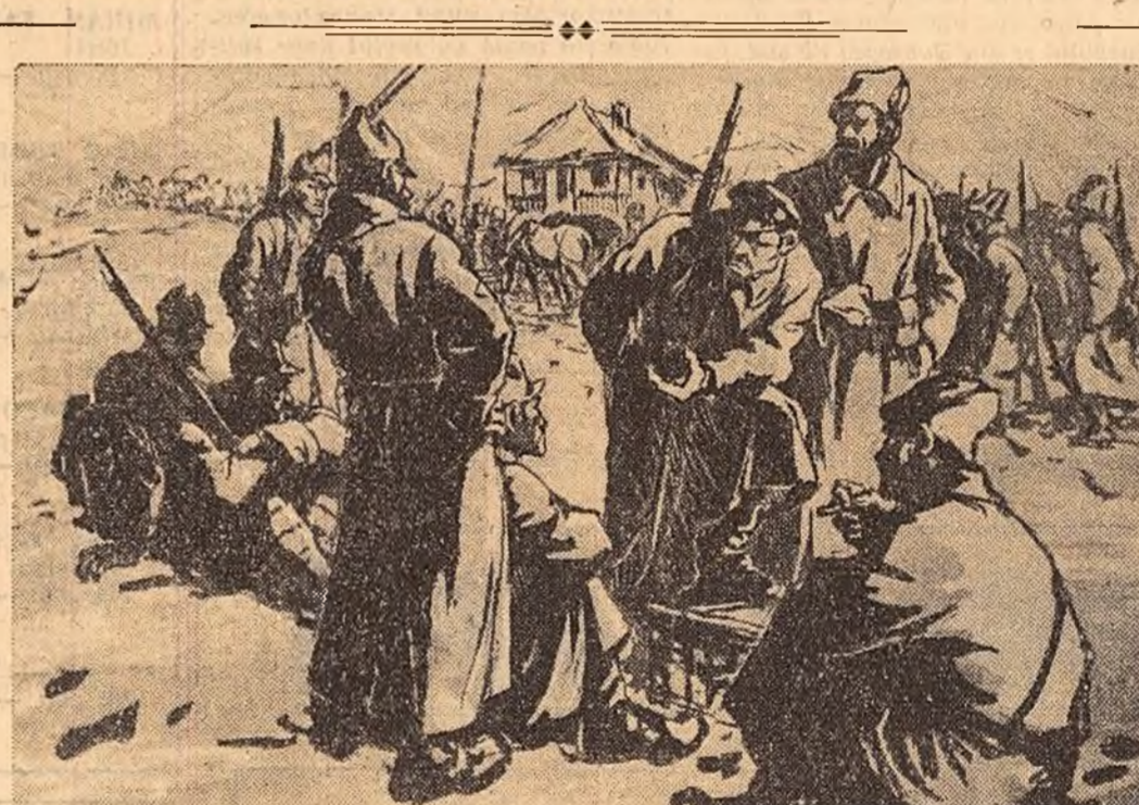
M. CHIRNOAGA (Expoziția interregională de pictură, sculptură și grafică) 1917 IN MOLDOVA