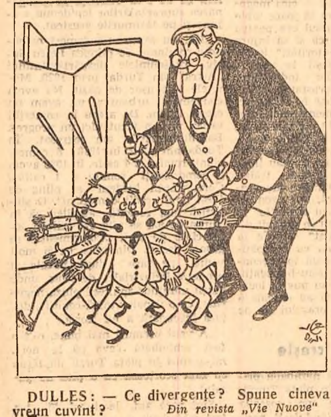
DULLES: — Ce divergențe? Spune cineva vreun cuvînt? Din revista „Vie Nuove”