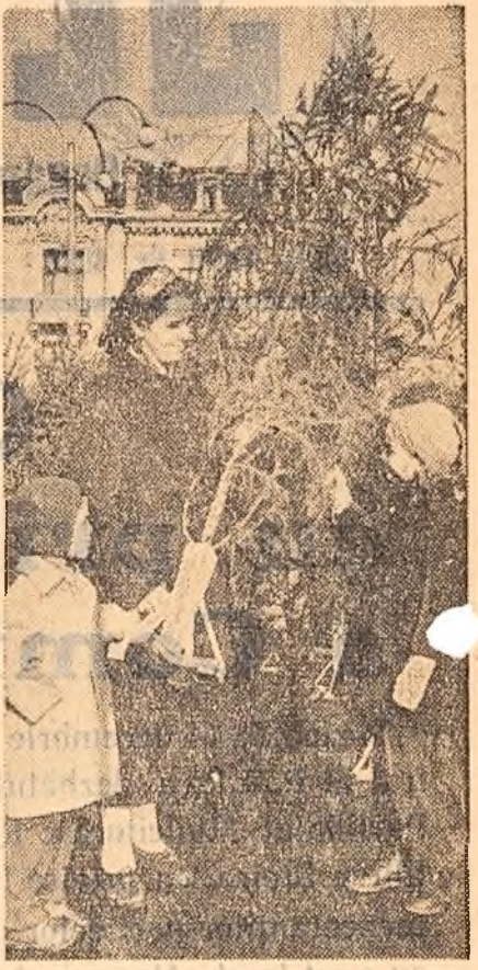
O marfă „verde și proaspătă” de sezon — pomii de iarnă. Cei doi copii din fotografie fac de pe acum planuri cum să orneze mai frumos brăduțelul.