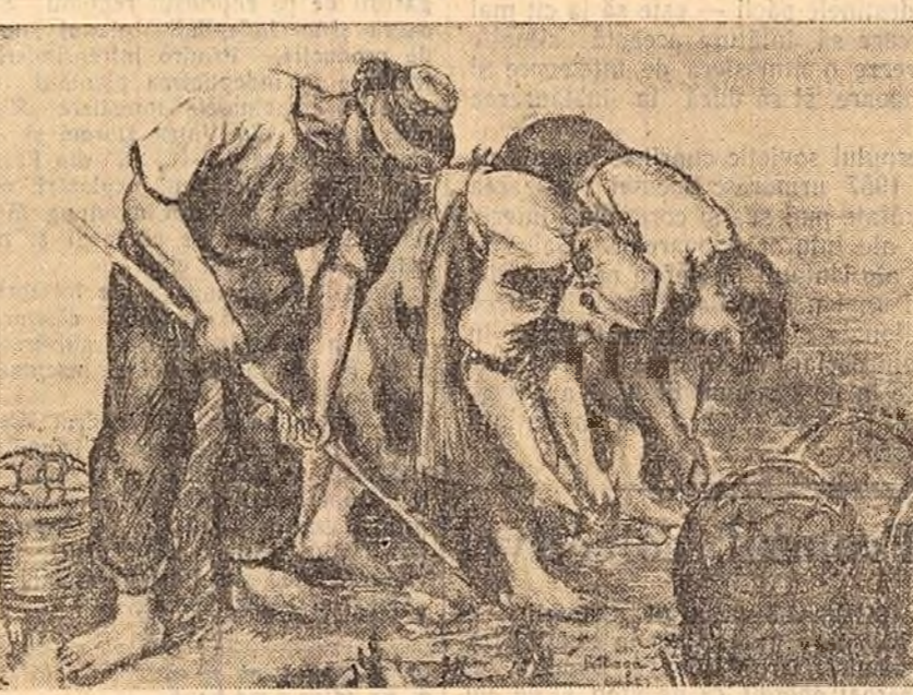
Dumitrescu Moga Rezeda (Expoziția interregională de pictură, sculptură și grafică)