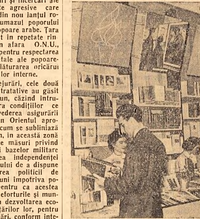
Cu prilejul „Săptămînii cărții”, ieri a avut loc în sala Dalles deschiderea „Expoziției cărții”. În clădire: un aspect din expoziție. (Darea de seamă în pag. III-a)

De cîteva zile numeroși belgieni vizitează „Expoziția filatelică a țării lor de democrație populară” din Bruxelles, la care țara noastră expune un bogat și variat stand cu timbre rominești. Sînt prezentate în deosebi emisiunile din ultimii ani. De o prejurire deosebită s-au curat timbrele care reprezintă flora carpatică și sateliții. Vestea că România va mai trimite la expoziție noi emisiuni, cu imagini din delți, a fost primită cu o vie curiozitate de belgieni.