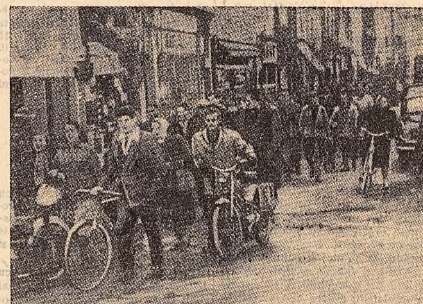
FRANȚA: Șomerii din Calais, oraș greu lovit de criza economică, demonstrează cerînd să li se acorde alocații de șomaj