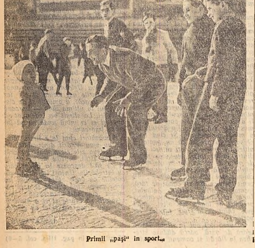
Primii „pași” în sport.

● Sezonul de schi din acest an a fost inaugurat duminică prin organizarea unui concurs pe prînzile de pe Postăvarul, Zăpada abundentă căzută în ultimele două zile a asigurat disiparea întrecerilor în cele mai bune condiții.