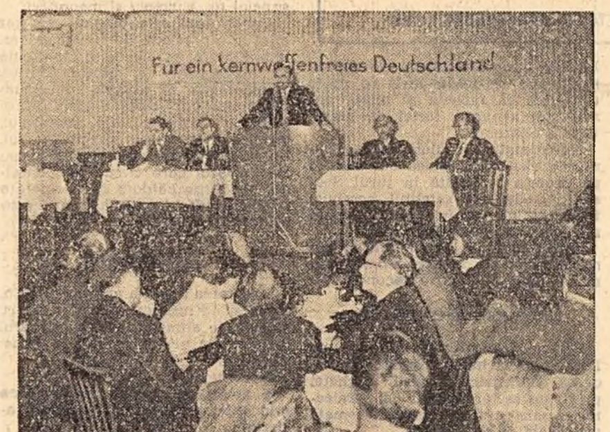
Congresul studenților vestgermani care și-a ținut recent lucrările la Berlin s-a pronunțat împotriva înarmării atomice a Germaniei occidentale. În clipse, scriitorul vestgerman Robert Jungk prezintă la congres un referat împotriva înzestrării Bundeswehrului cu arme atomice.

„Este necesar, arată în continuare Comitetul administrativ al E.D.A., ca politica păcii, prieteniei și încrederei să devină politica externă oficială a Greciei. Politica cea a legat Grecia de carul politicii imperialiste a S.U.A. implică o primejdie de moarte pentru țară și o duce în impas”.