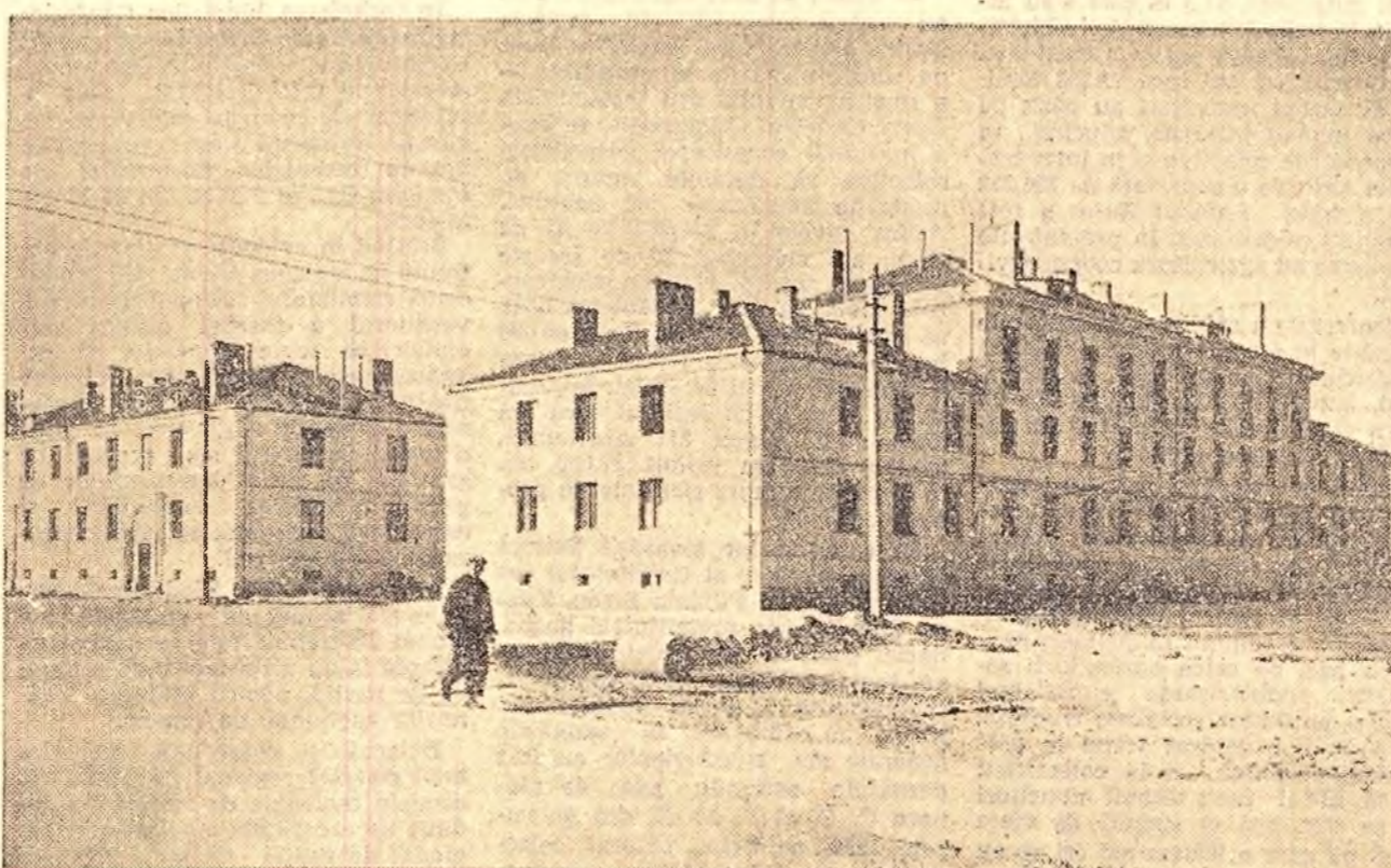
Pe lângă fabrica de cărămizi silico-calcare de la Doaga s-au construit numeroase locuințe noi. De asemenea s-au construit aici și cîteva magazine care aprovizionează pe muncitorii fabricii cu produse textile și alimentare.