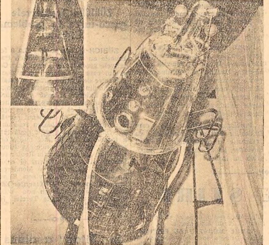
Zilele acestea, în sala Dalles, se va deschide expoziția „U.R.S.S. în plin avânt al construirii comunismului”, în cadrul căreia vizitatorii vor avea prilejul să vadă, în mărime naturală, reproducerea ale celor 3 sputnici lansajii de Uniunea Sovietică.