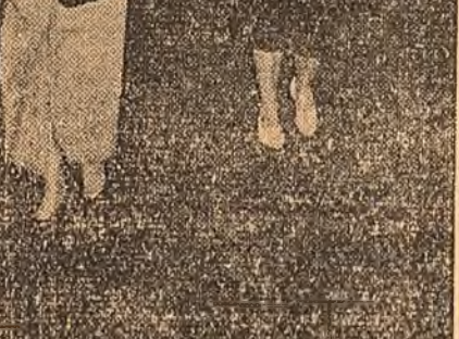
În anul referendumului în problema acordării dreptului de vot femeilor elvețiene, la Zürich a avut loc o mare demonstrație a femeilor.

În zădar! Ca și în trecut, femeile elvețiene nu au obținut dreptul de vot.