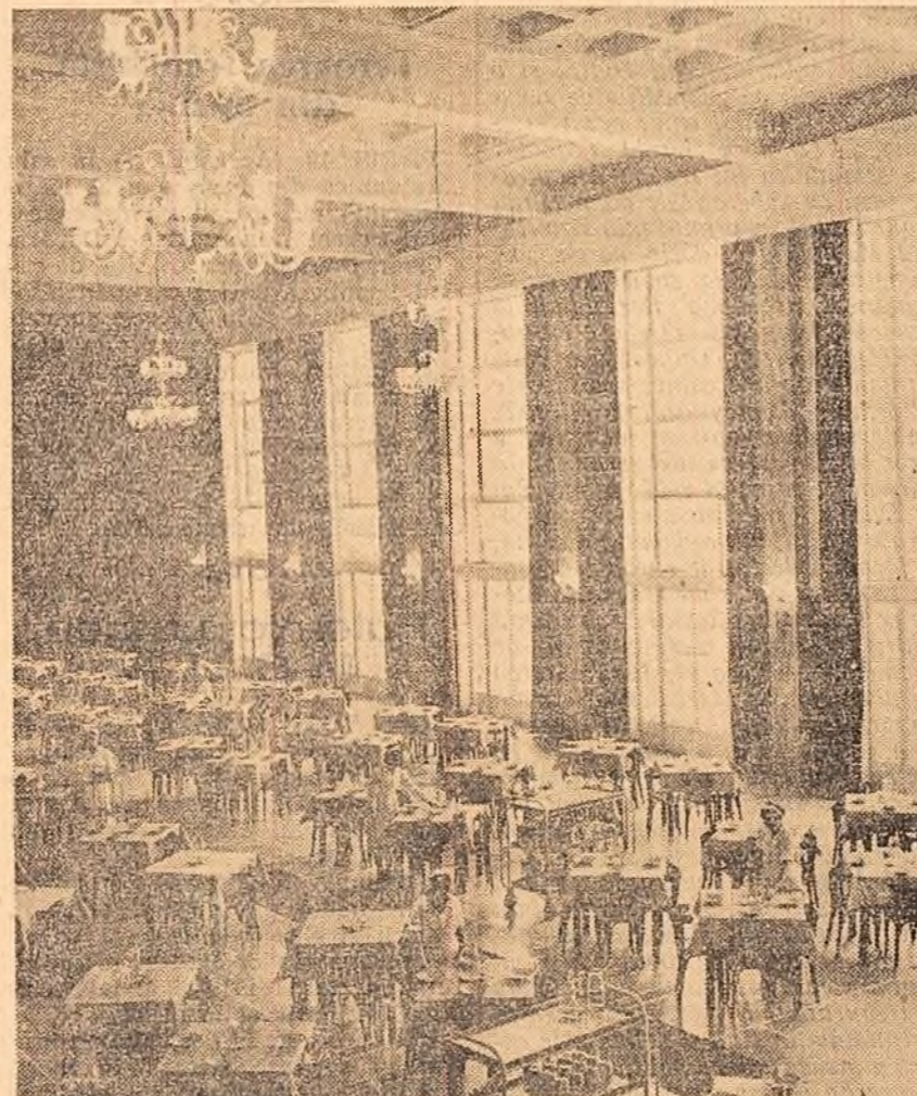
Muncitorii complexului C.F.R. „Grînvla Roșie” au la dispoziție numeroase obiecte social-culturale. În fotografie: Un aspect din sala de mese a noii cantine

zintă avantajul că la specialitatea respectivă se poate expune o gamă mai completă de sortimente, calitatea lor de utilizare cumpărătorului să poată alege ceea ce are nevoie. Deservind mai bine pe cumpărător, acest sistem urmează să se extindă în 1959 îndeosebi în sectorul produselor industriale. Îndeplînindu-se atenția mai ales asupra magazinelor din cartierle centrale, și comerciale ale principalelor orașe. Pentru confecționarea și încălțăminte, specializarea rețelii va fi orientată estelîncît pînă la sfîrșitul anului 1960. În principalele orașe vînzarea acestor articole să se facă numai prin magazine specializate. Organele sanitare din cadrul Departamentului C.F.R. întreprind în prezent o acțiune profilactică de prevenire a saturnismului în locurile unde se lucrează cu plumb. De asemenea se întreprind o serie de studii asupra reducerii gazelor nocive pe locomotive mai ales în trecerea lor prin tuncel. Pentru dezvoltarea turismului pe litoral și în Delta Dunării s-au luat anul acesta o serie de măsuri speciale. Astfel se vor construi 6 nave de pasageri costiere cu o capacitate de 100 locuri fiecare ce vor fi date în folosință odată cu începerea sezonului balnear. Se vor construi de asemenea 12 salupe de agrement și 2 vase de pasageri fluviale, pentru excursii, care vor face legătura între Marea Neagră și Dunărea. Aceste vase ce se construiesc în șantiierul navei Oțelăria sînt dotate cu tot confortul, avînd circa 300 locuri de dormit în cabine.