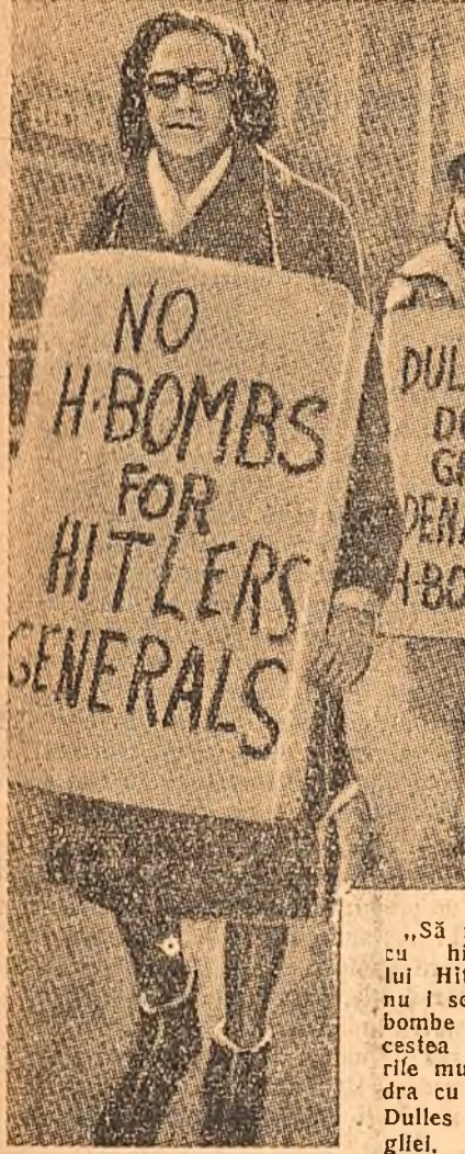
„Să nu se dea bombe cu hidrogen generalilor lui Hitler! „Dulles! Să nu se dea lui Denauer bombe cu hidrogen!...”