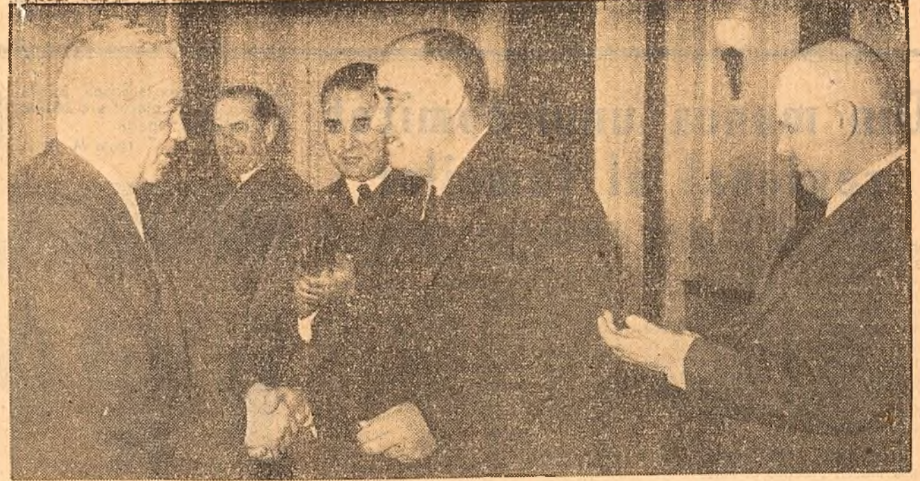
La Prezidiul Marii Adunări Naționale, după înmînarea înaltei distincții tovarășului Emil Bodnăraș.

CLUJ (coresp. „Scinteia”). — Zilele trecute colectivștii mai vechi din gospodăria colectivă din Luduș parcă au reușit să scape de acum un an și s-au întins în gospodărie. Colectivștii se adunaseră ca să dezbăta activitatea gospodăriei pe un an întreg. Încă pe măsură ce se discuta dăra de seamă a consiliului de conducere, la masa prezidiului au început însă să sosească cereri prin care țărani muncitori din sat își exprimau dorința să fie primiți în gospodărie. Cererile au fost discutate pe rând. Astfel în ziua de 5 februarie au fost permise în gospodăria colectivă din Luduș 182 de familii de țărani muncitori. Munca de lămurire dusă în cursul săptămânii trecute de către organizația de partid își arată roadele.