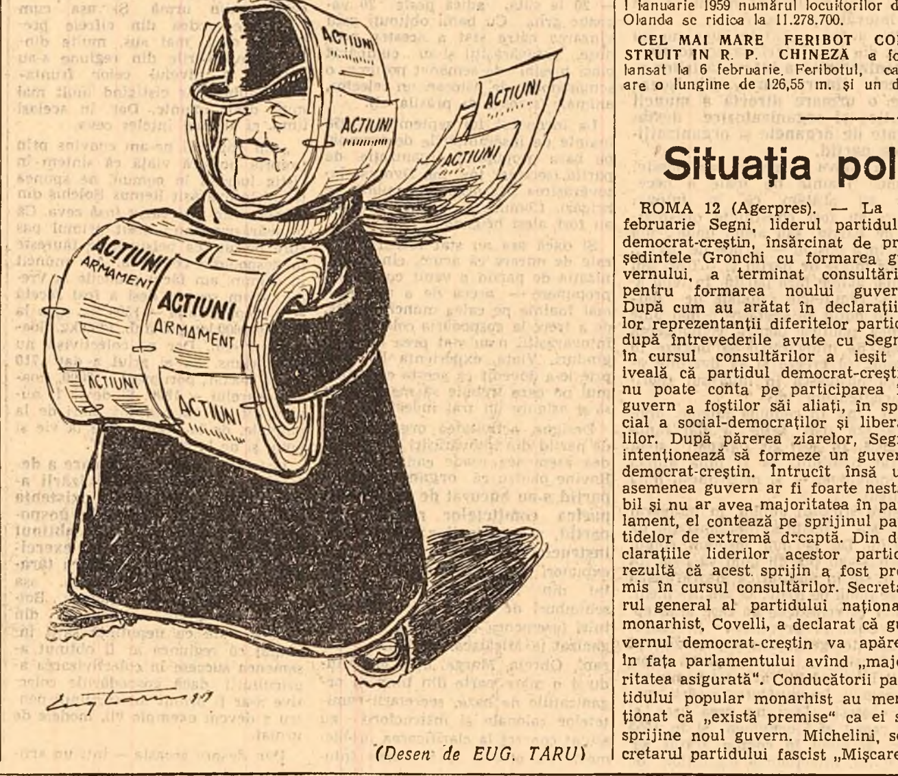
(Desen de EUG. TARU)