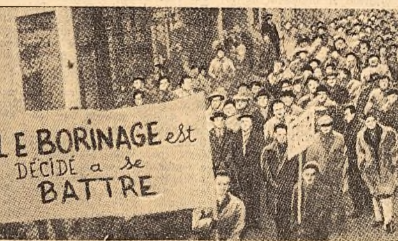
Mii de mineri au demonstrat în orașul belgian Mons împotriva închiderii minelor. Numai în primele zile ale acestui an, peste 550 de mineri au fost aruncați în stradă.