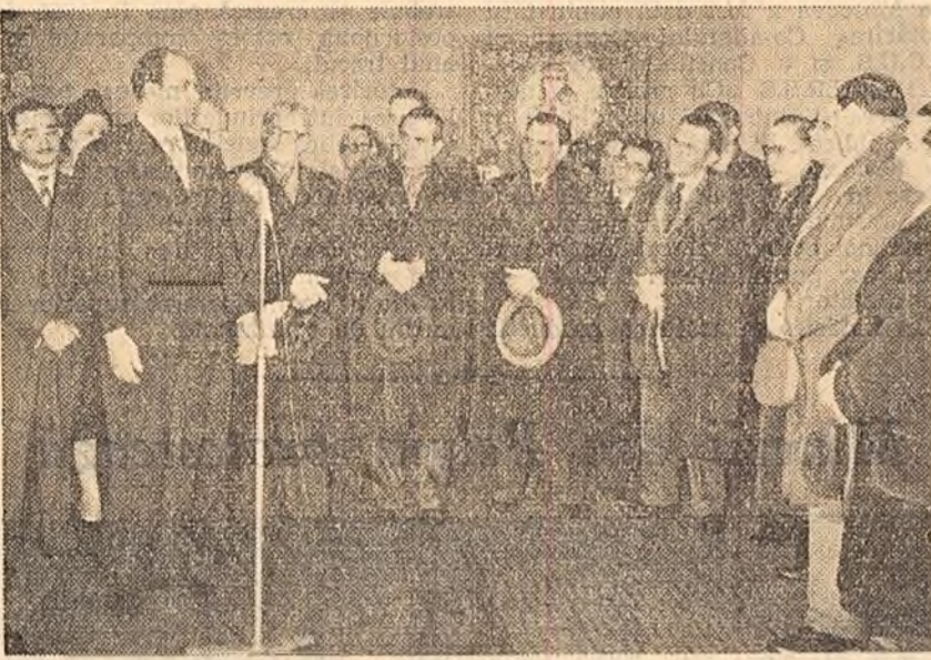
Aspect de la deschiderea expoziției

Simbătă la amiază a avut loc, în sala „Nicolae Cristea” din Capitală, deschiderea Expoziției de artă egipteană contemporană.