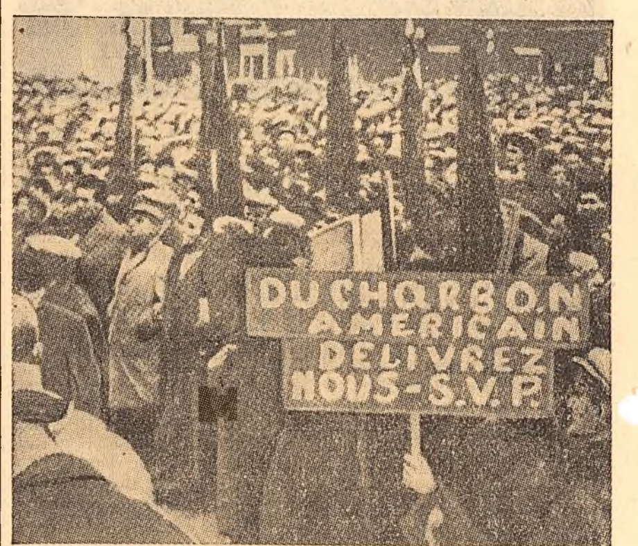
În timp ce închiderea minelor azvire pe drumuri zeci de mii de mineri, în Belgia continuă să sosescă transporturi de cărbune american, care au rolul de „spărgător de grevă” împotriva puternicei mișcări greviste a minerilor belgieni.