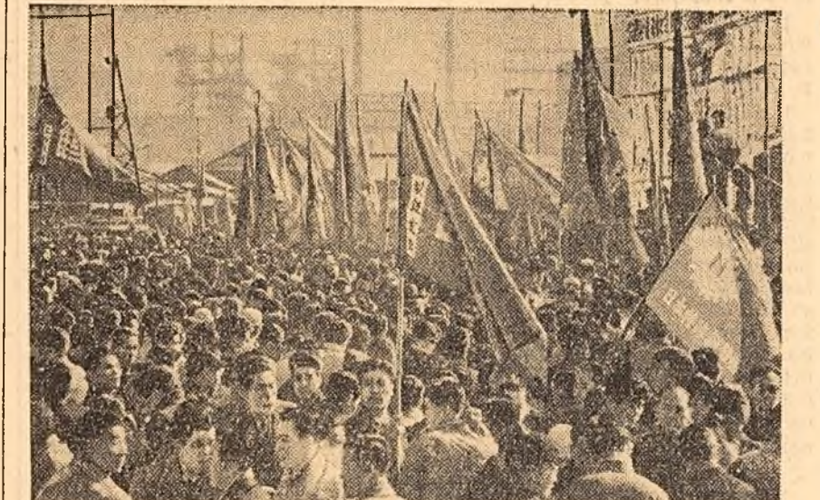
Mii de metalurștii din orașul Kawasaki, prefectura Kanagawa (Japonia) de monstrează împotriva somajului, pentru îmbunătățirea condițiilor de trai

soli ai prefecturilor Tiba Saitama ai regiunilor Kansai, Tiugoku și altele. La acest marș împotriva războiului și a somajului au participat peste un milion de persoane. La 4 martie sînt locuincile luptei pentru pace, pentru democrație, pentru îmbunătățirea condițiilor de trai ale poporului, în întreaga Japonie au avut loc mîșcări și demonstrații ale oamenilor muncii, la care au participat peste 4 milioane de oameni.