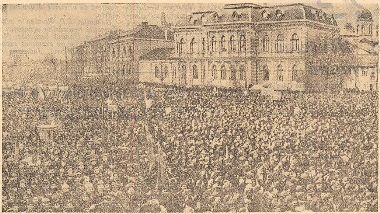
Un aspect de la uriașul miting de masă al oamenilor muncii din Capitală care a avut loc la 6 Martie 1945.