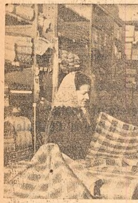
Megazinele cooperative sînt tot mai bine aprovizionate cu mărfurile de care au nevoie țărânii muncitori. În fotografia: Magazinul cooperative de consum din comuna Săliște, raionul Sibiu.

În funcționarea învățămîntului seral și fără frecvență au ieșit în evidență deficiențe serioase și abateri de la hotărârile privitoare la acest învățămînt.