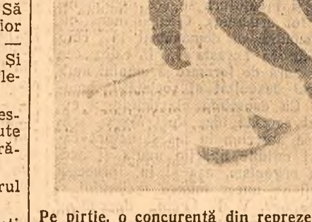
Pe pîrțile, o concurență din reprezentativa regiunii Stalin

Pe pîrțile de la Poiana Stalin au luat sfîrșit duminică întrecerile de schi din cadrul celei de-a IV-a ediții a Spartachiadei de iarnă a tineretului. De-a lungul celor 3 zile de întreceri, participanții reprezintă 12 regiuni ale țării au luptat în însuflețire pentru obținerea victoriei, competiția crucuind un remarcabil succes.