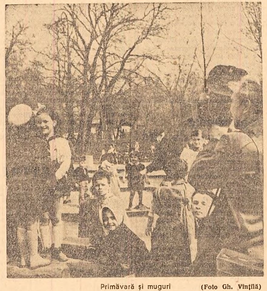
Primăvară și muguri