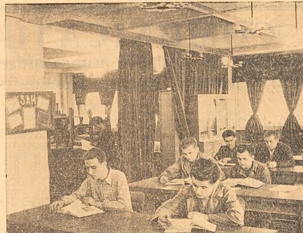
In incinta întreprinderii „Electroaparat” funcționează o bibliotecă înzestrată cu peste 8000 volume. Muncitorii, tehnicienii și inginerii fabricii găsesc aici, pe lângă cărți de știință, tehnică, literatură beletristică și numeroase publicații, reviste, buletine care informează pe cititorii esur nouților științifice și tehnice din lumea întreagă. Fotografia înfățișează un aspect al sălii de lectură a bibliotecii.

Se pun temeliile noi pretutindeni. Se conturează cartiere moderne. Asistăm la împlinirea bulevardelor. Construcim într-un an, cit burghezia în decenii. Și din toate muncile pe care le face poporul nostru, se pare că cea mai bine î se potrivește munca de constructor. O putem lua în ambele ei sensuri — la figurat și la propriu — deoarece clădim nu numai în înfuleșul strict al civiltății, — uzine și case — ci și bună stăruie, viața nouă, oglindită în atmosfera senină și caldă a familiei, în relațiile noi dintre oameni. Așa se transformă cu fiecare zi Bucureștiul, țara noastră. Capitala noastră i se spune azi „orașul grădinilor”. E plăcut să constatăm că în numai câțiva ani, anii aceștia de muncă slobodă, au răsarit odată cu uzine și blocuri, grădini și parcuri verzi pe locul maldanelor de odinioară. In rindurile tineretului, aceste transformări au un ecou puternic. Tineretea țării este o generație de la început combatantă, ea participă cu un entuziasm lesne de înțeles la tot ce poate fi temelie vieții noi. Partidul nostru încredește tineretului munci de răspundere. Să ne amintim numai de sanzierele naționale ale tineretului, de brigăzile de muncă patriotice, de acțiunile gospodărești pentru economie. Se pot enumera alte multe exemple. Dar argumentația ar fi de prisos. Fiecare