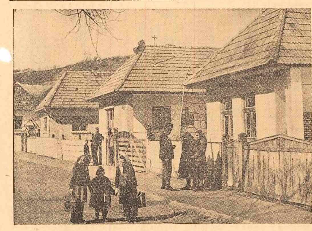
Satul Curtoni, raionul Tg. Mureș: Aspect de pe Strada colectiviztilor. In cursul ultimului an, 25 de membri ai gospodăriei colective din sat și-au construit noi locuințe, iar alți 40 au case în construcție

Cind a fost semnat pactul anti-komintern, care avea să aducă cel mai din istoria omenirii, Ribbentrop a spus că „acest acord constituie o garanție a păcii în lumea întreagă” iar Ciano a declarat că pactul „nu este îndreptat împotriva nimănuui... Este o armă pusă în slujba păcii și civilizației”. Pactele agresive sint ca acele arme de contrabandă ambalate în lăzi pe care stă scris „Jucărli” sau STERGIU FARCAȘAN (Continuare în pag. 3-a, col. 5-7)