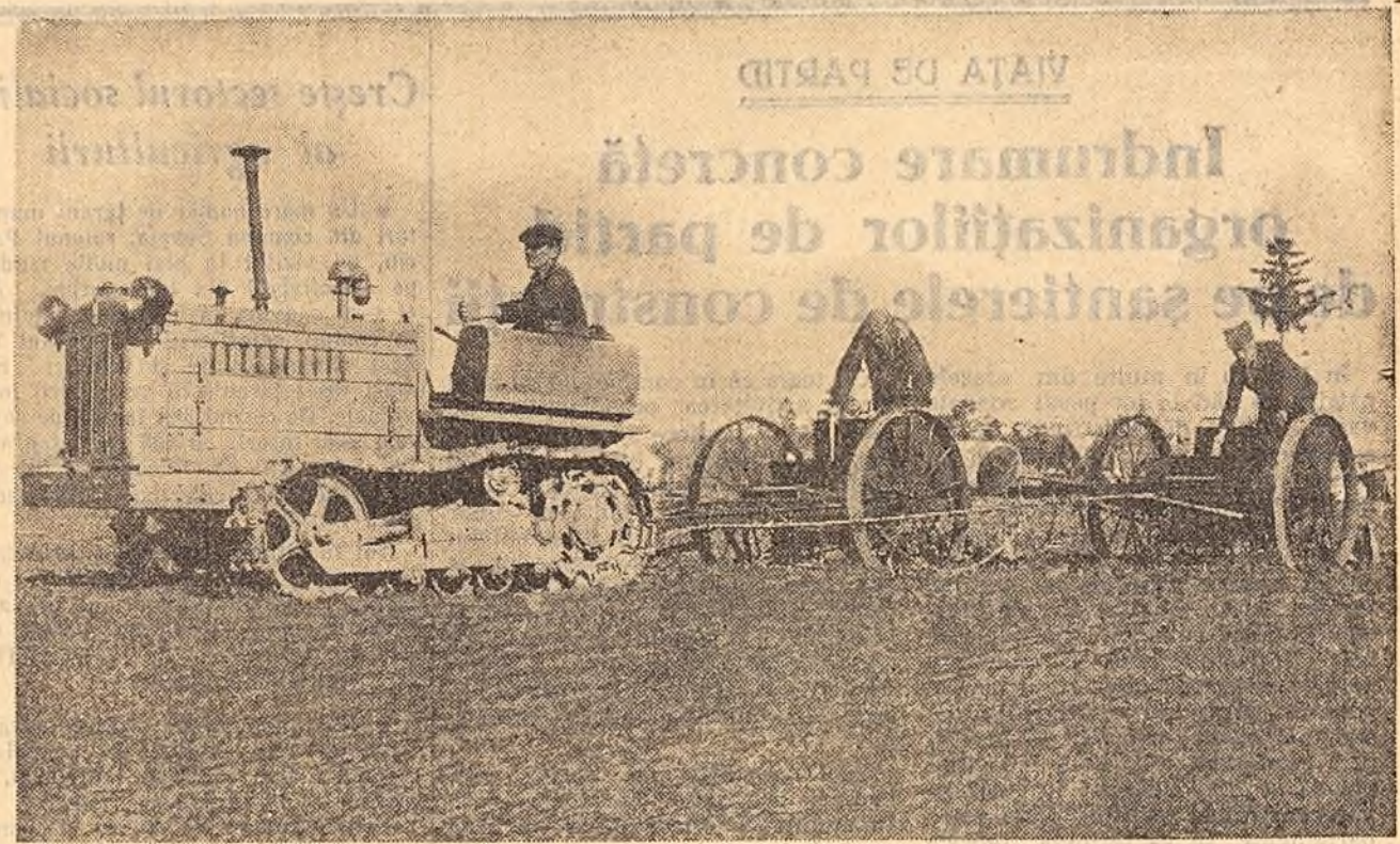
La gospodăria de stat Sîncral, raionul Tg. Mureș, cartofii se plantează cu ajutorul mașinilor ceea ce face ca productivitatea muncii să crească foarte mult.