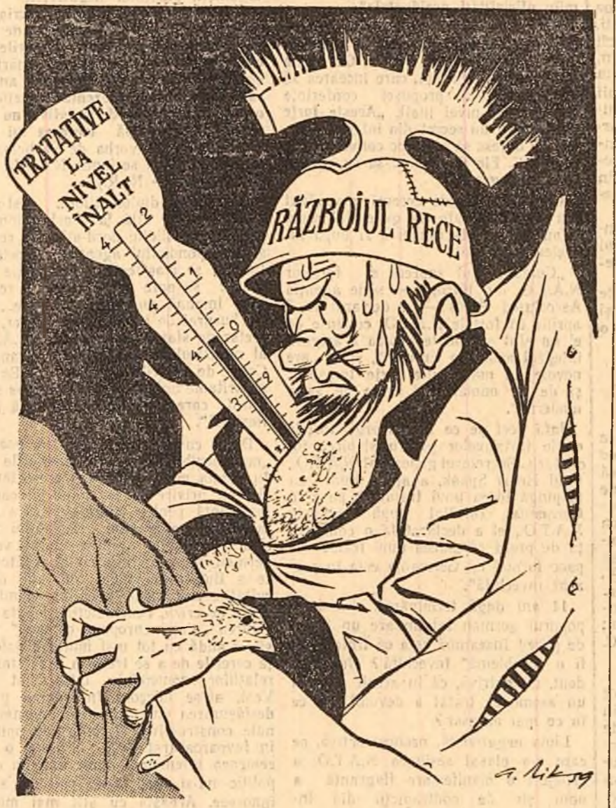
— Mă trec sudorile și tot urcă... urcă... desen de RIK AUERBACH

Potrivit agenției France Presse legea a fost semnată la 6 aprilie de către guvernatorul statului, Orval Faubus, înrău adepți al segregării rasiale. El a refuzat cu încăpăținare să aplice legea votată de către Congres privind desființarea segregării rasiale.