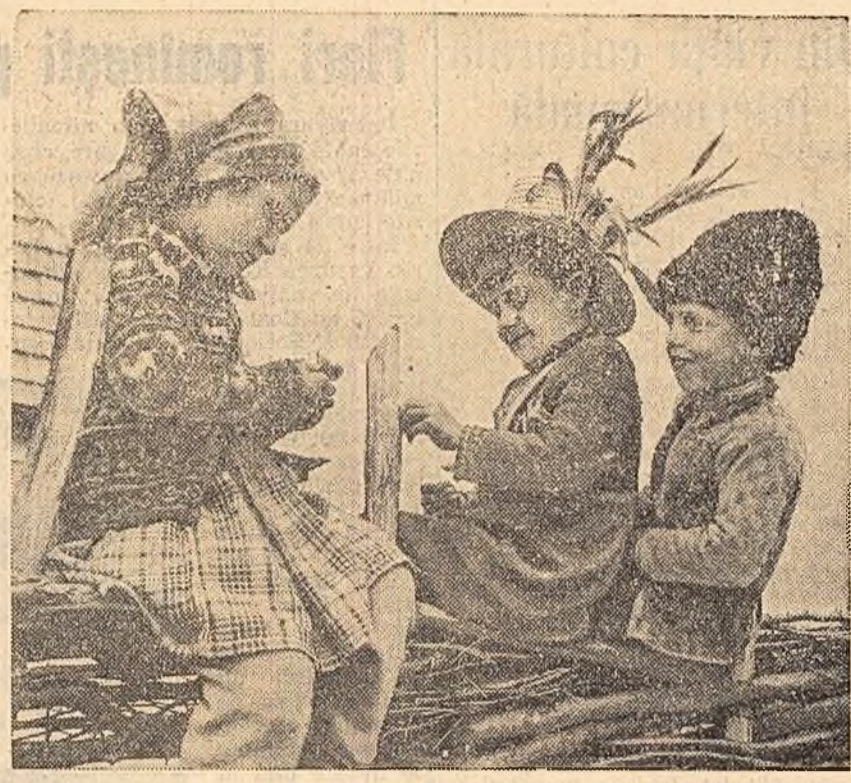
La sfat, ca între vecini...