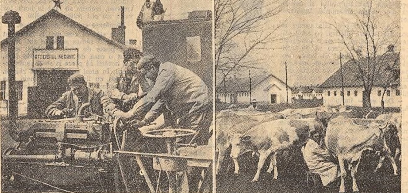
Lucrătorii gospodăriei de stat Afumați, regiunea Craiova, luptă, în cadrul întrecerii socialiste, să obțină rezultate cit mai bune în toată raionul agricol al unității. Se termină în timp semănatul culturilor din prima epocă; după ce au împrăștiat îngrășăminte chimice pe 531 ha. și 700 tone gunoi de grajd și au pregătit bine terenul, mecanizatorii au început însămînzatul porumbului. În același timp muncitorii de la G.A.S. Afumați execută o serie de alte lucrări la fermele de animale, în sectorul mecanic etc. În fotografia din stînga: mecanizatorii lucrează la repararea mașinilor de recoltat cereale păioase. În fotografia din dreapta: o parte din cîreada de vaci a gospodăriei. Anul trecut, gospodăria a obținut cite 2.500 l. lapte de fiecare vacă furajată. Anul acesta planul trimestrial la lapte a fost de asemenea depășit.