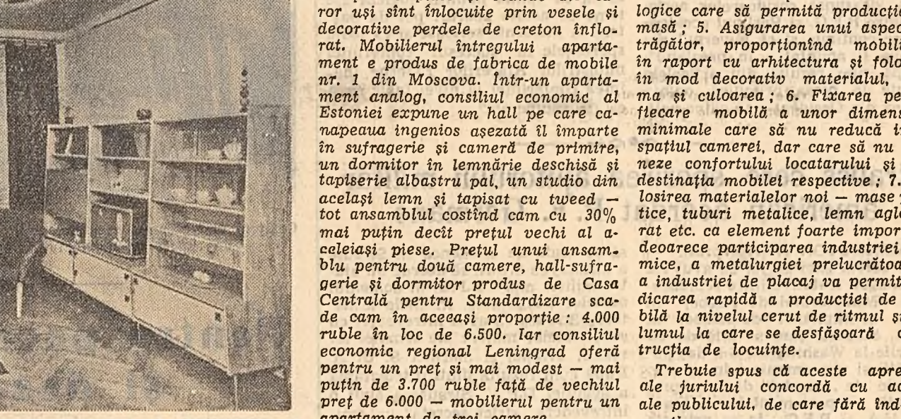
O cameră — dintr-un apartament de două camere — mobilată după proiectele Casei Centrale pentru Standardizare.