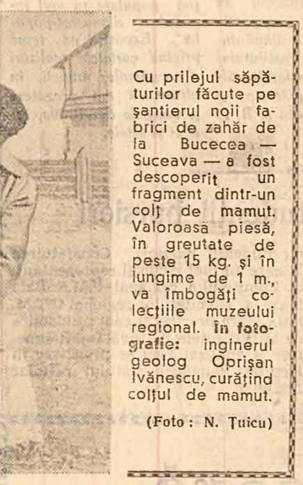
Cu prilejul săpăturilor făcute pe șantierul noii fabrici de zahăr de la Bucecea — Suceava — a fost descoperit un fragment dintr-un colț de mamut. Valoarea piesei, în greutatea de peste 15 kg. și în lungime de 1 m., va îmbogăți colecțiile muzeului regional. În fotografie: inginerul geolog Opreșan Ivănescu, curățînd colțul de mamut.