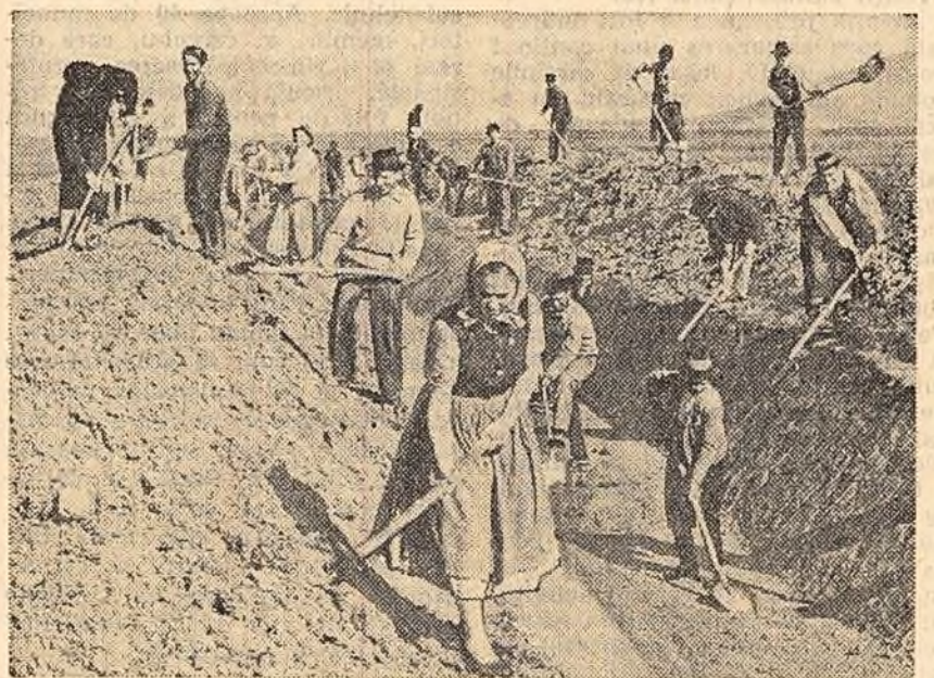
In aceste zile sute de colectivști și întovărășiți din comunele Ineu, Selesu, Șicula, Moroda, Mocrea și altele, din raionul Ineu, regiunea Oradea, muncesc cu însuflețire pentru săparea unui canal lung de 8 km. care va salva de la inundații aproape 2.000 ha. In fotografie: Un aspect de pe șantierul de la marginea comunei Șicula.

In regiunea Bacău — la Bacău, Roman, Piatra-Neamț și alte centre s-au deschis în acest an, pînă acum, șantiere pentru construcția a 700 apartamente. Aceste locuințe se construiesc din fonduri centralizate și din fondurile întreprinderilor. Proiectele prevăd ca suprafața locuibilă să reprezinte peste jumătate din cea construită, iar aspectul clădirilor să fie frumos. Fiecare apartament va dispune de o balcon sau loggie.