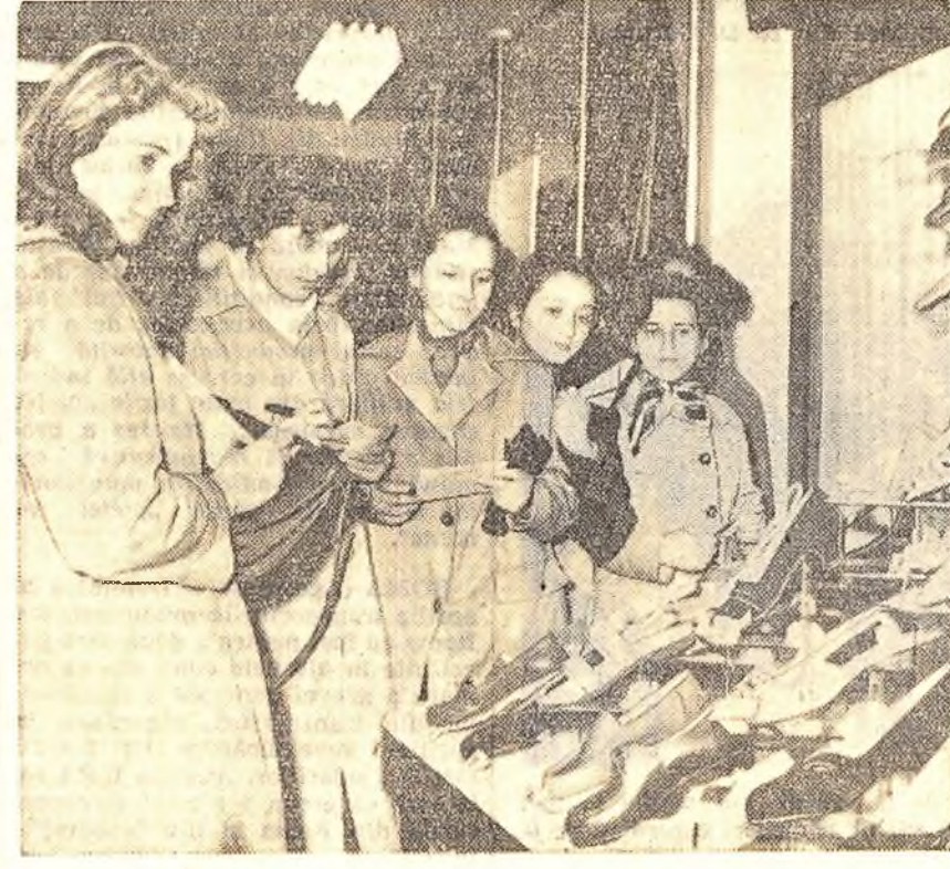
E greu să te decizi care model e mai frumos.

O asemenea posibilitate, scrie însă ziarul „Avghi”, provoacă o serioasă neliniște în rîndurile opiniei publice