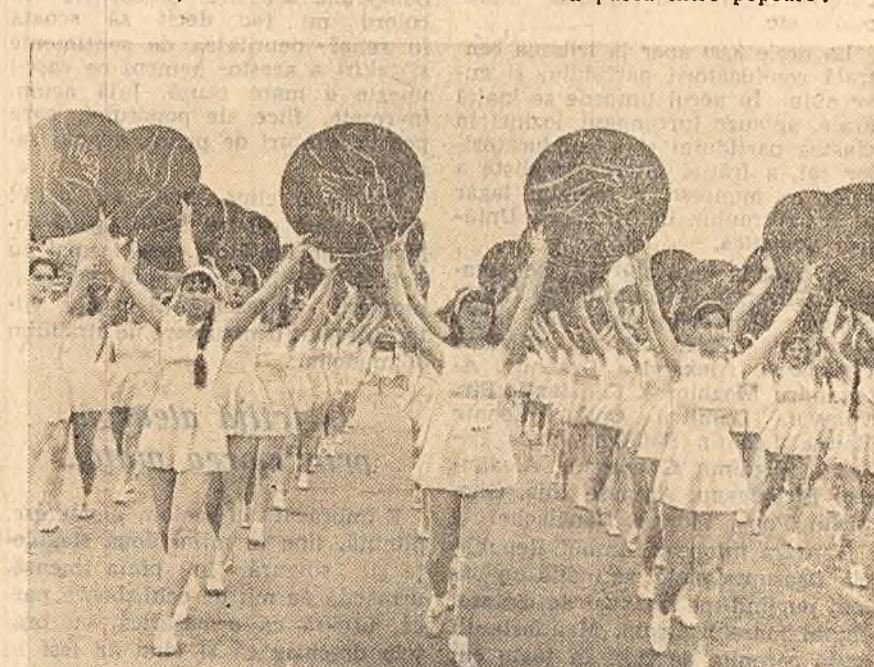
În coloanele sportivilor...