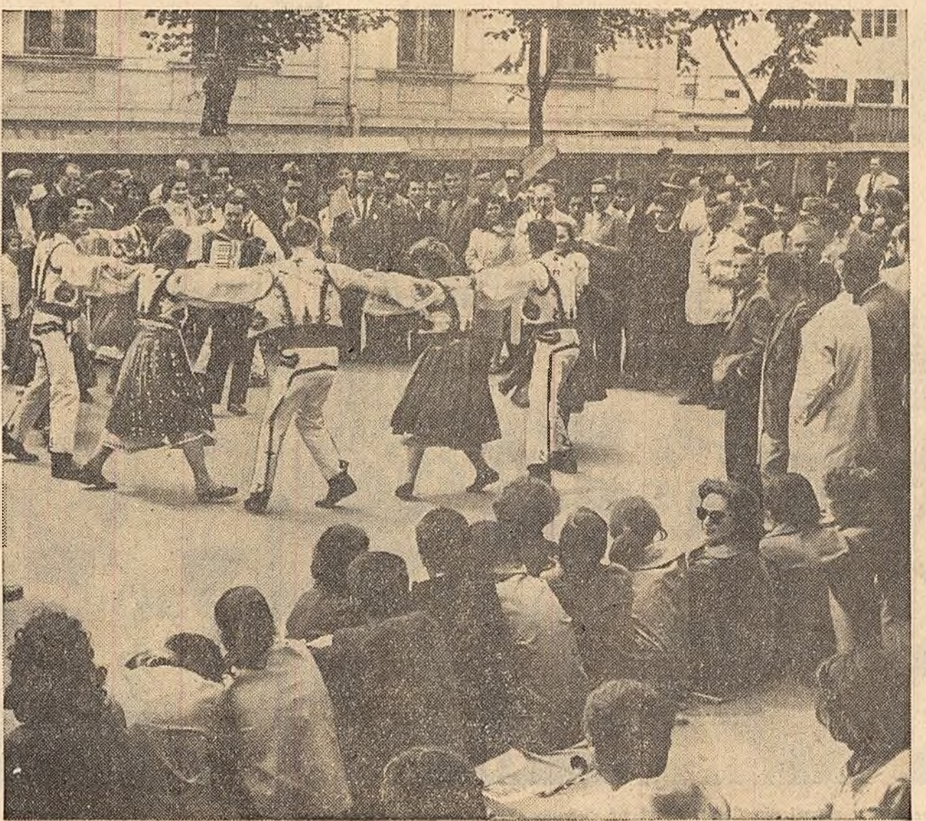
...Așteptîndu-și rîndul la defilare