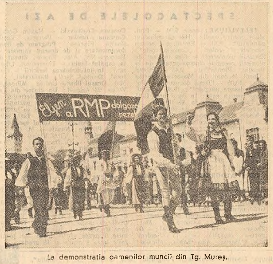
La demonstrația oamenilor muncii din Tg. Mureș.