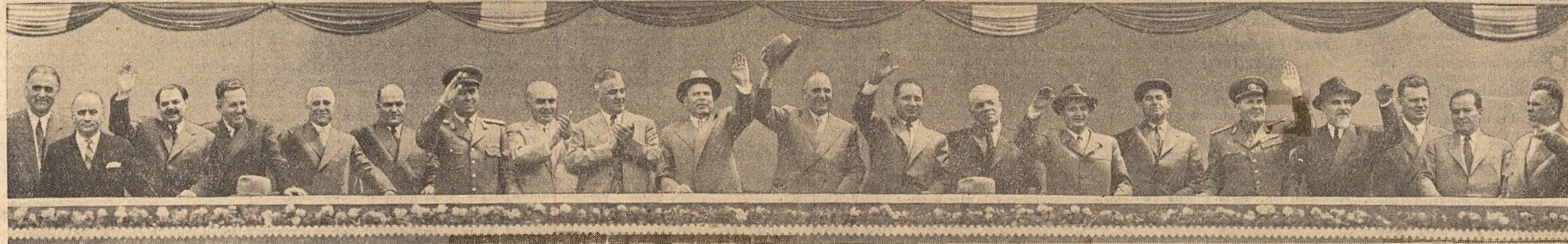
Tribuna centrală în timpul demonstrației oamenilor muncii din Capitală