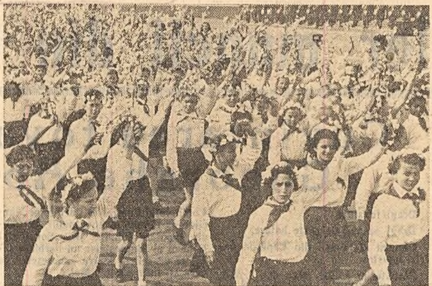
Agîtînd cu vioioșe buchete de flori, trec pionierii — schimbul de mîine.

36.352.000 lei: la atât se ridică economiile realizate peste plan de