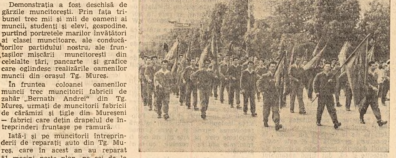
Pe frumosul bulevard din orașul Ploiești trec în ordine coloanele muncitorilor.