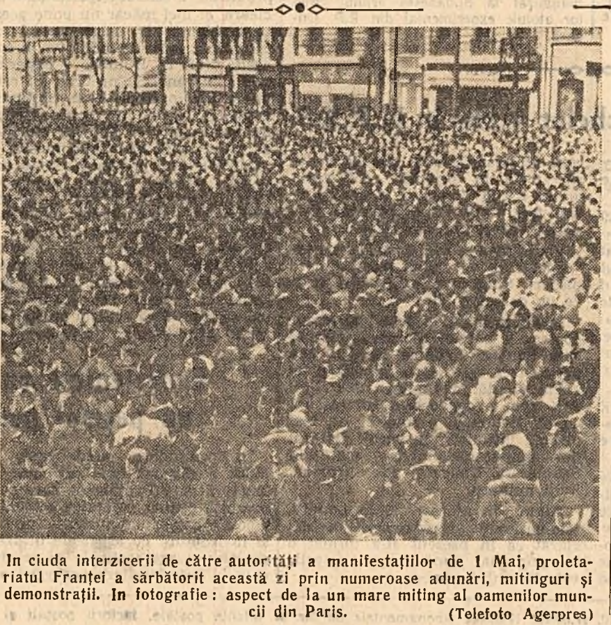
În ciuda interdicției de către autorități a manifestațiilor de 1 Mai, proletariatul Franței a sărbătorit această zi prin numeroase adunări, mitinguri și demonstrații. În fotografie: aspect de la un mare miting al oamenilor muncii din Paris.