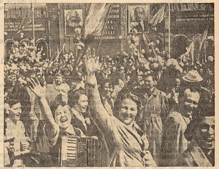
Un aspect de la demonstrația oamenilor muncii din Piața Roșie

nal democrat din Irak. Sînt de asemenea de față membri ai corpului diplomatic, atașajii militari străini. Cel prezenți au salutat prin aplauze furtunoase apariția la tribuna Mausoleului a conducătorilor partidului comunist și guvernului sovietic — A. B. Arislov, L. I. Brejnev, E. A. Furteva, N. S. Hrușciov, N. G. Ignatov, A. I. Kiricenco, F. R. Kozlov, A. I. Mikoian, M. A. Suslov, N. M. Svernik, K. E. Vorosilov, D. S. Poletanski. Parada a fost primită de mareșalul R. I. Malinovski, ministrul Apărării al U.R.S.S. Mareșalul Malinovski a adresat soldaților, matrozilor, ofițerilor, oamenilor muncii din Uniunea Sovietică și oaspeților de peste hotare tradiționala cuvîntare de 1 Mai.