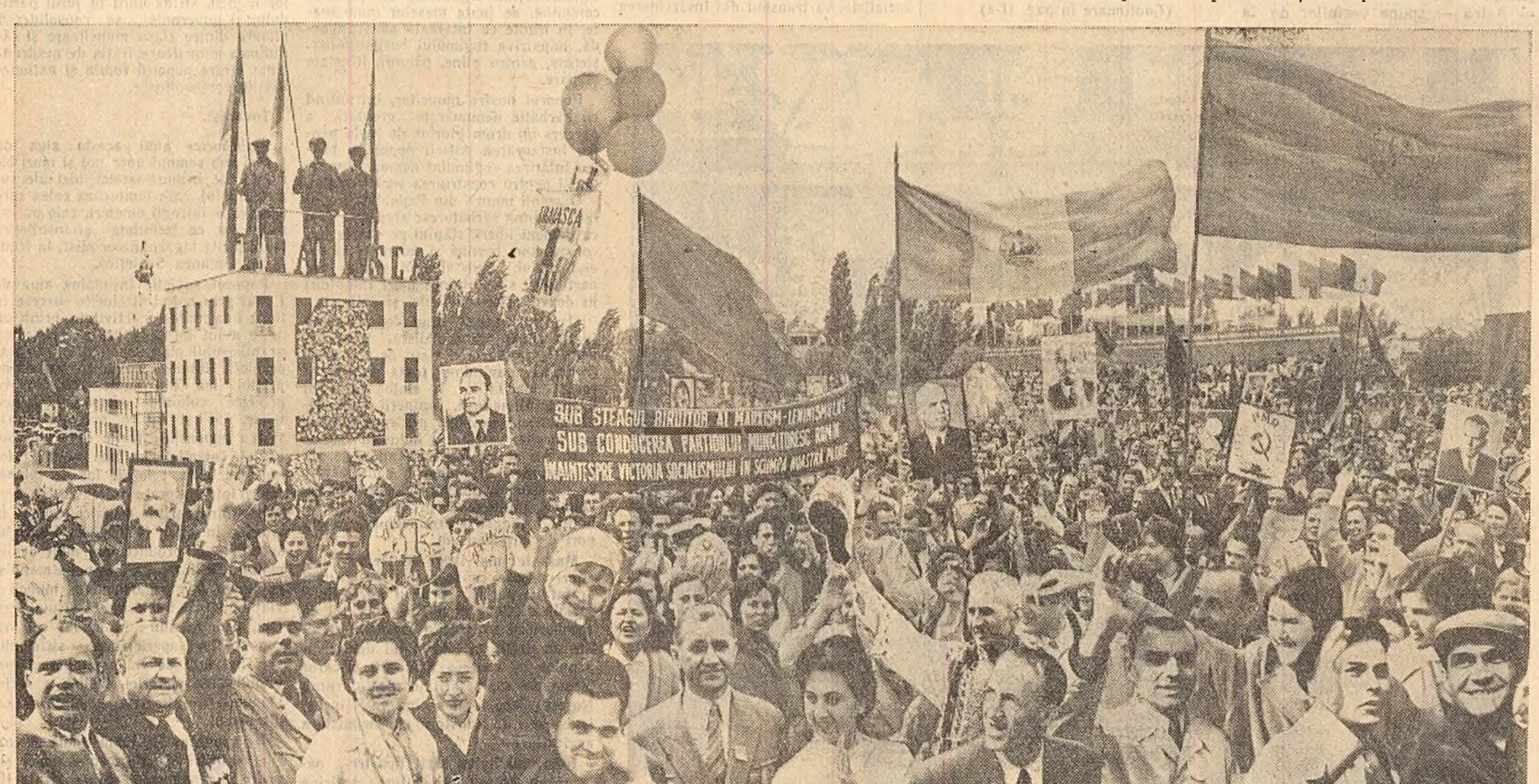
Participanții la marea demonstrație a oamenilor muncii din Capitală aclamă cu entuziasm pentru partid și guvern.