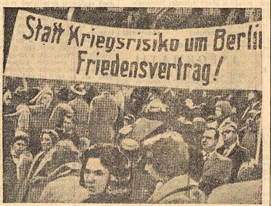
Puternica manifestație de 1 Mai a muncitorilor din Essen (Germania occidentală) s-a desfășurat sub lozincă „În locul primejdiei de război de la Berlin, un tratat de pace!”

LONDRA 5 (Agerpres). — Selwyn Lloyd, ministrul Afacerilor Externe al Angliei, luind cuvântul în cadrul programului de televiziune din seara zilei de 4 mai a acordat corespondentului ziarului „Observer”, William Clark, un interviu cu privire la apropiatele tratative dintre Vest și Est. El a subliniat că poporul englez este interesat ca și popoarele Uniunii Sovietice în evitarea unei asemenea catastrofe cum este războiul mondial. S. Lloyd a declarat că Anglia se prezintă la conferința de la Geneva cu dorința fermă de a începe tratative adevărate. Referindu-se la apropiata Conferință a miniștrilor Afacerilor Externe de la Geneva, Lloyd a spus: „Este absurd să ne așteptăm ca toate problemele asupra cărora există divergențe să fie rezolvate la o singură conferință. Cred însă, că dacă cele două părți vor tinde spre tratative adevărate — și după părerea mea, așa va fi — va exista o bază pentru tratative”. După părerea lui Lloyd, conferința miniștrilor A-