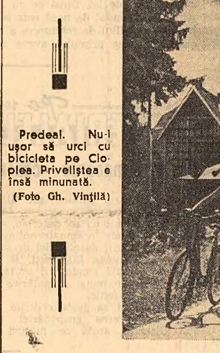
Predeal. Nu-l ușor să urci cu bicicleta pe Clopș. Priveliștea e însă minunată.