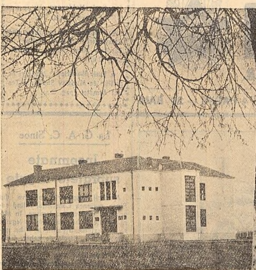
La Craiova, a fost dat în folosință o clădire unde își duc activitatea stațiunea experimentală a Institutului de cercetări forestiere. Fotografia reprezintă noua clădire a Institutului.