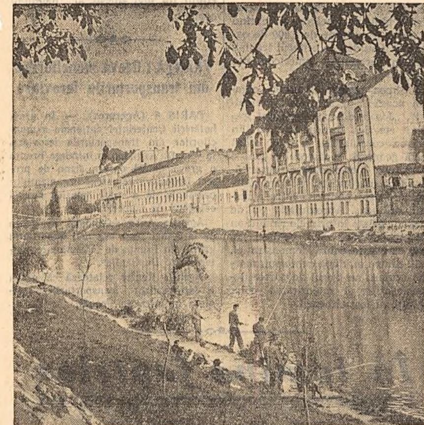
Cu undița pe malul Crișului