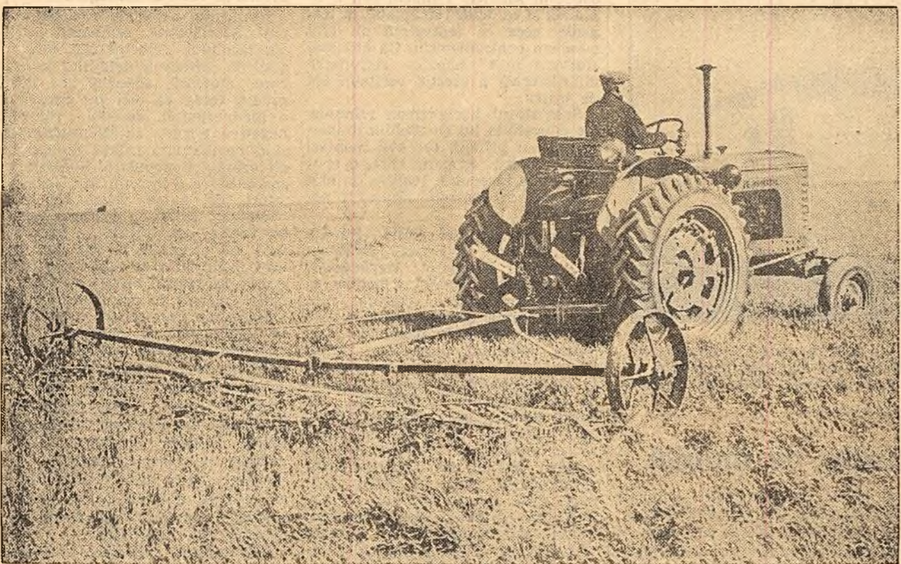
Membrii gospodăriei colective „Ilie Plintile” din comuna Roman ralonului Botoșani dau o atenție deosebită îngrijirii culturilor. Fotografia reprezintă grăpatul grîului pe tarla de 40 de ha, de la punctul denumit Zamca. Tractorul Popa Mihai de la S.M.T. Botoșani a executat 113 ha. În loc de 87 ha. cit a avut planificat.

Aspecte privind lărgirea atribuțiilor sfaturilor populare din regiunea Cluj