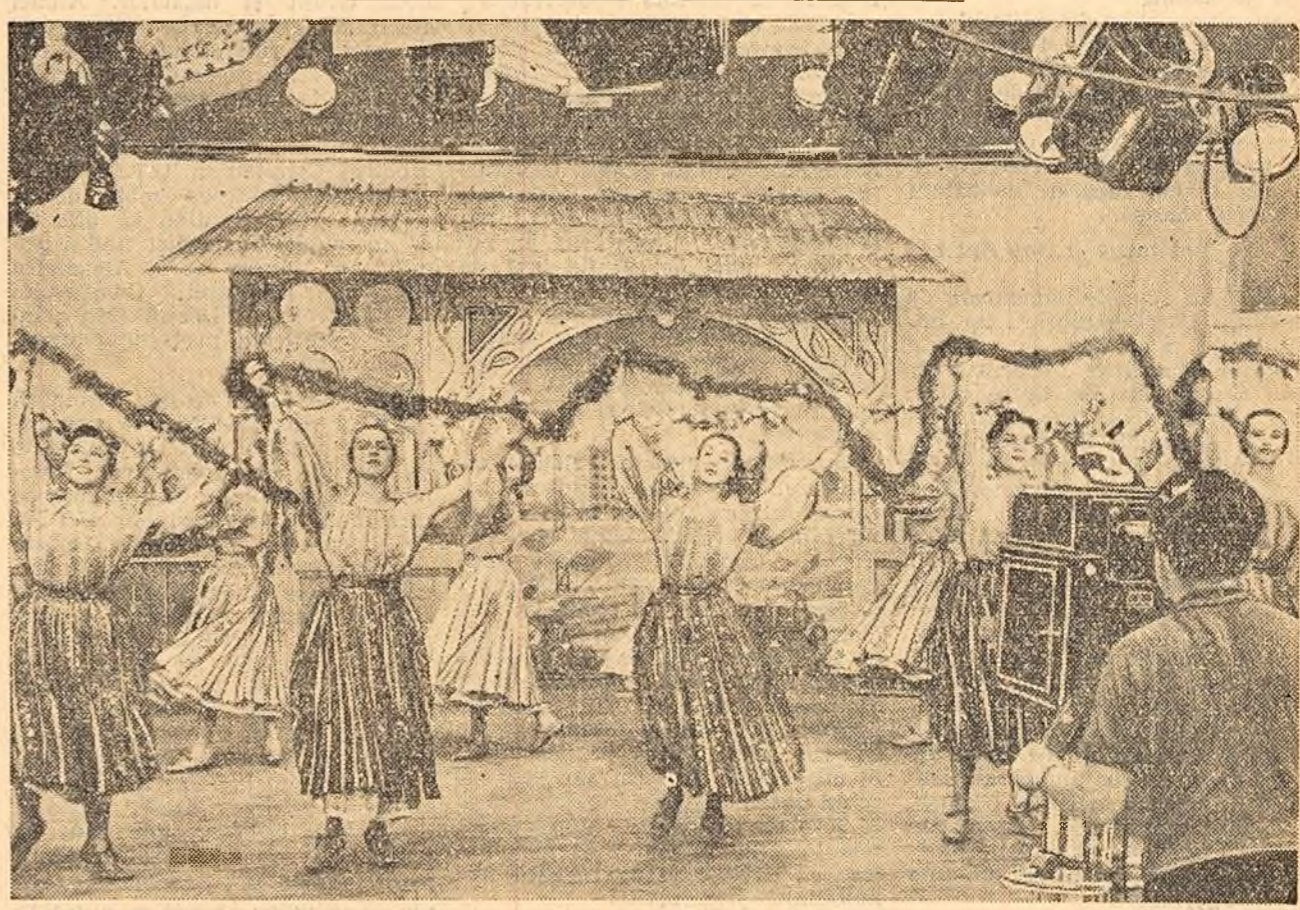
Prin străduința muncitorilor, tehnicienilor și inginerilor care lucrează în sectorul televiziunii, în ultimul timp au fost aduse îmbunătățiri tehnice utilajelor de televiziune existente, care au dus la ridicarea calității transmisiunilor. Datorită intrării în exploatare a unei noi stații de televiziune, programelor Centrului de Televiziune „București” pot fi recepționate și în partea de mijloc a Moldovei. În fotografie: Aspect de la transmisia spectacolului prezentat de Ansamblul „Ciocîrlia” în studioul de televiziune „București”. (Cititi în pagina III-a a ziarului articolul „Pe drumul dezvoltării radiofoniei noastre”.)