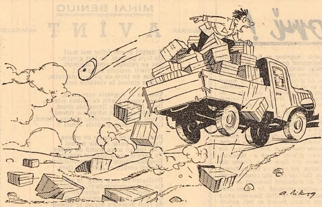
Oprește!!! Mi-a căzut șapca!!!

Organizația comunistilor romini a fost constituită în orașul Samara în luna mai a anului 1919.