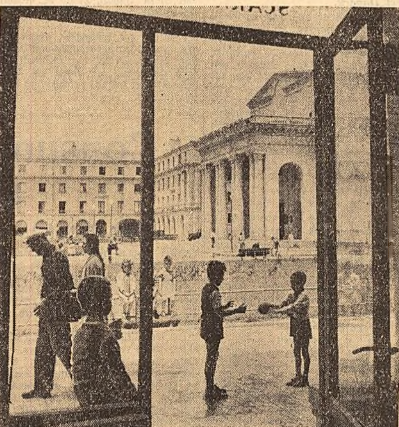
Vedere din Bucureștii Noi.