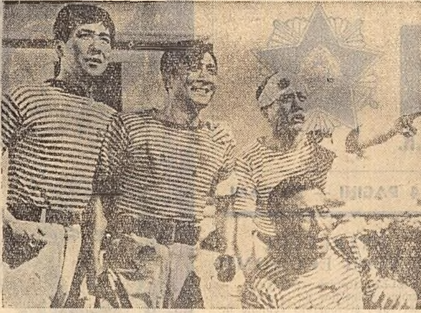
Imagine din filmul „Sufletul mării”, producție a studioului din R. P. Chineză, care va rula în curînd pe ecrane.

Expoziția a fost vizionată de colectivele întreprinderilor din cadrul T.I.L.-Pitești, I.F.I.L.-Craiova și T.I.L.-Lugoj. Expoziția urmează să aibă și la alte întreprinderi asemănătoare din Sighet, Arad, Reghin, București, Bacău etc.