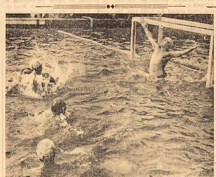
Dinamo a mai inserat un punct... dar scorul final a fost favorabil echipei C.C.A. (faza din derbiul campionatului de polo C.C.A. — Dinamo, câștigat cu 6-4 de C.C.A.).

Dintre echipele de jocuri și dansuri populare a obținut rezultate bune echipa din Dăbica, raionul Hunedoara. Pe primul loc s-au situat și echipa de flautiști din Jina, raionul Sebeș, fanfara din Lupeni, orchestra de mandoline a întreprinderii „I. Mai” din orașul Deva. De o apreciere unanimă s-au bucurat și programele prezentate de către membrii brigăzilor de agitație din cadrul exploatarii miniere Aninoasa și din comuna Drașov, raionul Sebeș.