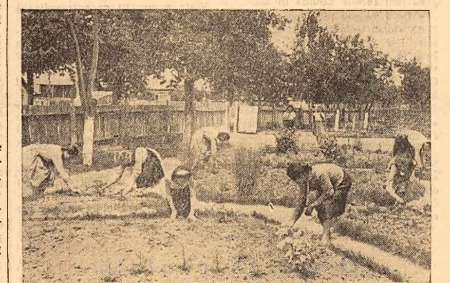
În perioada lucrărilor practice, micii naturaliști de la școala de 7 ani din Ștefănești, raionul Drăgășani, îngrijesc florile din parcul școlii.