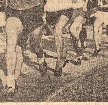
Algerătorii lui 1.500 m. au luat startul (fază din cadrul campionatelor republicane școlare de atletism).