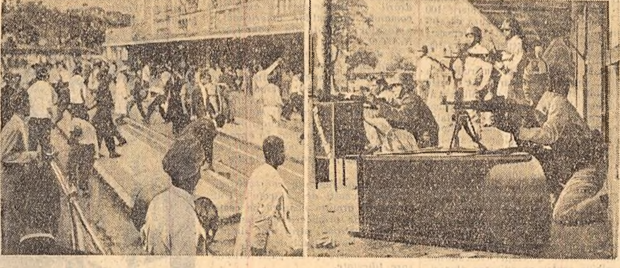
În cadrul grevei declarate de funcționarii bancari din capitala Argentinei pentru obținerea unor condiții mai bune de trai...