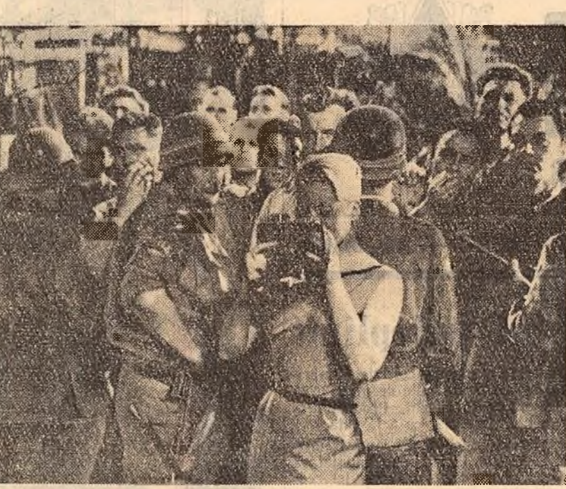
Scenă din filmul „Escadrila Liliacul” care va rula în curînd pe ecranele cinematograferelor.

Cît de mult ar dori tinerii să discute în adunări sau să audă o conferință despre felul cum trebuie să se poarte în viața de familie, între prieteni. Se pare însă că Comitetul raional U.T.M. „Filimon Sirbu” a uitat să ajute comuna cu astfel de conferințe. Nici organizația de partid a comunei nu-i poate fi indiferentă problema educației tineretului. Comuna Jirliu este colectivizată în întregime. Aceasta este o dovadă că aci sînt mulți oameni înaintați și în primul rînd comuniștii care știu să muncească cu oamenii, să-i lămurească, să-i educe. Ei au datoria să nu uite de tineret. Am citat la început un pasaj din interesanta scrisoare adresată redacției noastre de cîteva utemisti din comuna Jirliu. Într-adevăr am constatat la fața locului că așa stau lucrurile. În vreme ce 130 utemisti participă la acțiuni importante de muncă patriotică, există cîteva care, din nepăsare, se țin deoparte. Le răspundem: Sîntem siguri că rîndurile pe care ni le-așii trimis vor fi ca un fel de oglindă pentru tinerii din comuna voastră. Și, mai știți, poate și din alte sate. SONIA MOLDOVANU