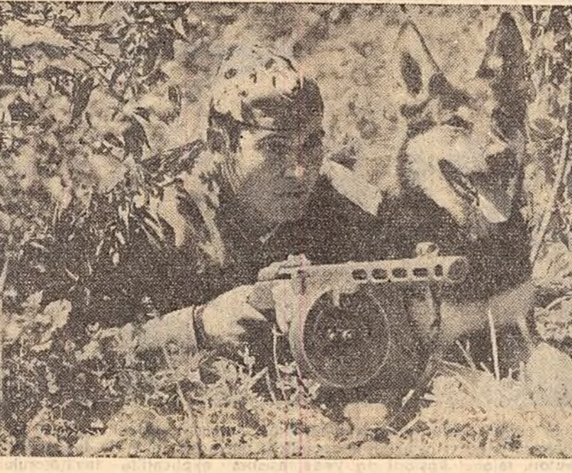
În ceasurile de veghe, la hotar.