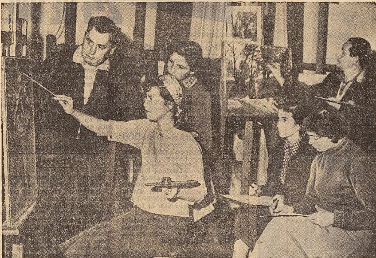
La Casa de cultură a Combinatului Metalurgic Reșița...