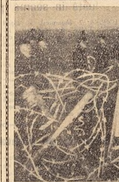
Demonstranții pe teritoriul bazei de rachete din Harrington.

CAIRO. Președintele Republicii Arabe Unite, Gamal Abdel Nasser, a primit pe I. Novikov, ministrul Construcțiilor de Centrale Electrice al U.R.S.S. I. Novikov vizitează R.A.U. cu prilejul apropiatei festivități a începerii lucrărilor pentru construirea primei părți a barajului de la Assuan.