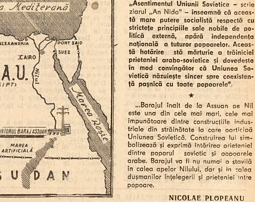
Marea Mediterană, LIBIA, R.A.U. (EGIPT), SUDAN

BERLIN 20 (Agerpres). — A.D.N. transmite: Biroul de presă al C.C. al P.S.U.G. a dat publicității un comunicat în care demască încercarea provocatoare a cercurilor guvernante de la Bonn de a arunca vina recentelor provocări fasciste și antisemite din Germania occidentală asupra comunistilor și Partidului Socialist Unit din Germania.