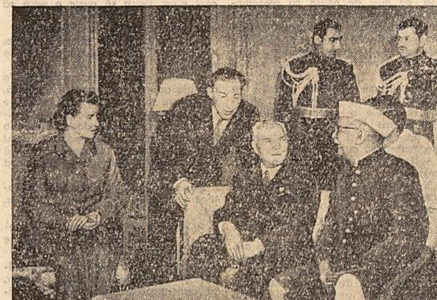
K. E. Vorosilov și E. A. Furfjeva în vizită la președintele Indiei R. Prasad