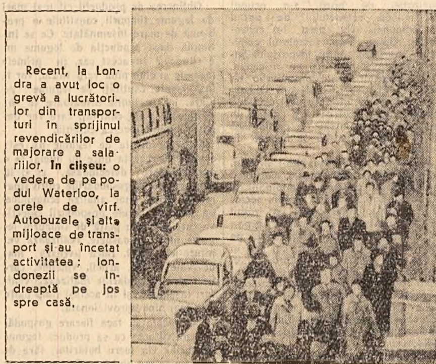
Recent, la Londra a avut loc o grevă a lucrătorilor din transporturi din cauza revendicării de mărjorie a salariilor. În clisou: o vedere de pe podul Waterloo, la orele de vîrf. Autobuzele și altele mijloace de transport și au încetat activitatea; londonezii se îndreaptă pe jos spre casă.