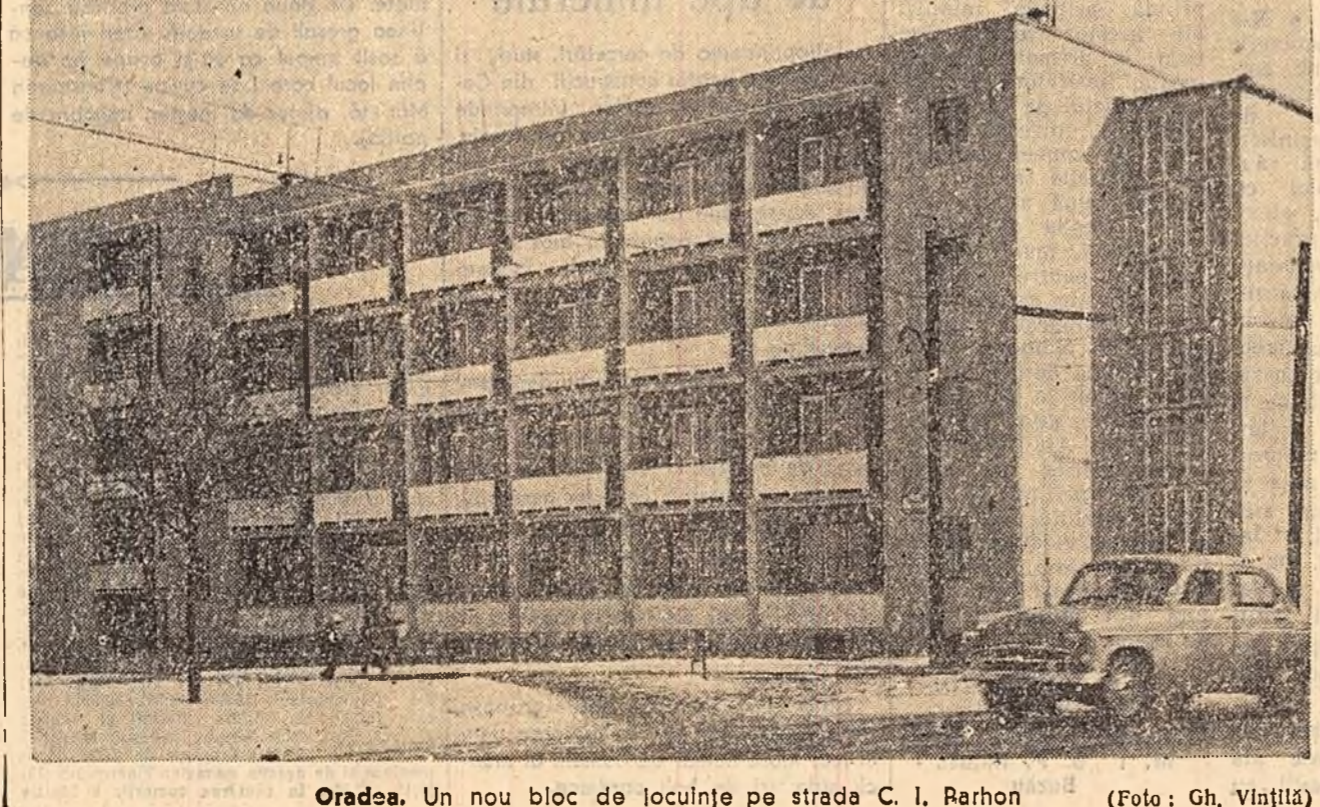
Orașea. Un nou bloc de locuințe pe strada C. I. Rarhon

Pe adresa Grădinii Botanice din București sosesc zilnic din toate colțurile lumii, cataloge de semînțe și de plante oferite în schimb din recolta anului 1959. Ultimele cataloge sînt din Poznan, Cracovia, Eberswald și Stockholm. La rîndul său, Grădina Botanică din București trimite catalogul pe 1959 unui număr de peste 300 grădini botanice din lume.