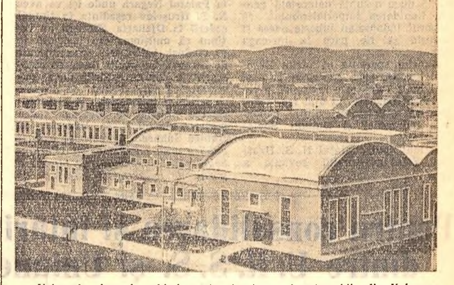
Uzina de piese de schimb pentru tractoare și automobile din Kolarovgrad (R. P. Bulgaria).

PARIS 18 (Agerpres). — Zilele trecute guvernul francez a comunicat organelor de conducere ale „micii zone a liberului schimb” din regiunea de la Paris sediul acestui organism. „În cercurile politice — scrie în legătură cu aceasta ziarul american „New York Times” — acest refuz este interpretat ca o lovitură politică îndreptată mai ales împotriva Marii Britanii (puterea predominantă în organismul „micii zone”, rival al „pieței comune” din care face parte Franța — N.R.). Franța — explică mai departe ziarul american — nu trește bănuțelul că Anglia ar urmări,