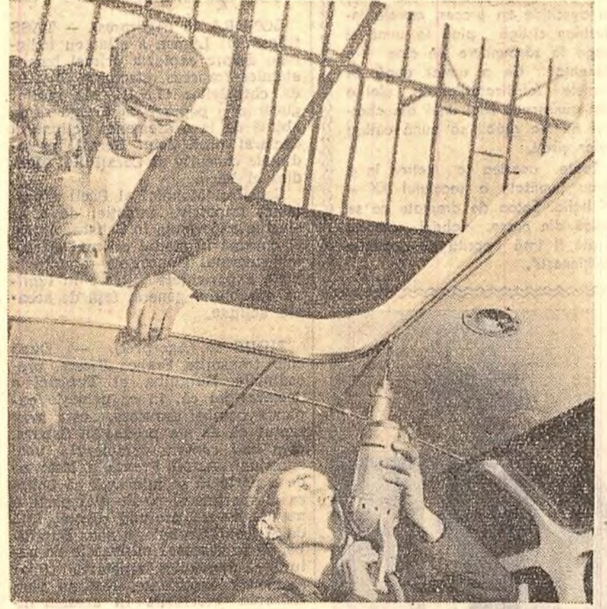
Colectivul halei de montaj a uzinelor „Tudor Vladimirescu” din Capitală obține realizări tot mai însemnate în întrecerea socialistă. În luna ianuarie, muncitorii și tehnicienii de aici au realizat economii în valoare de 81.000 lei, față de 75.000 lei cît prevăzuseră în angajament. În fotografie: o parte a brigăzii de finisare auto — una din brigăzile fruntașe — executînd lucrări de montaj la un troleibuz.