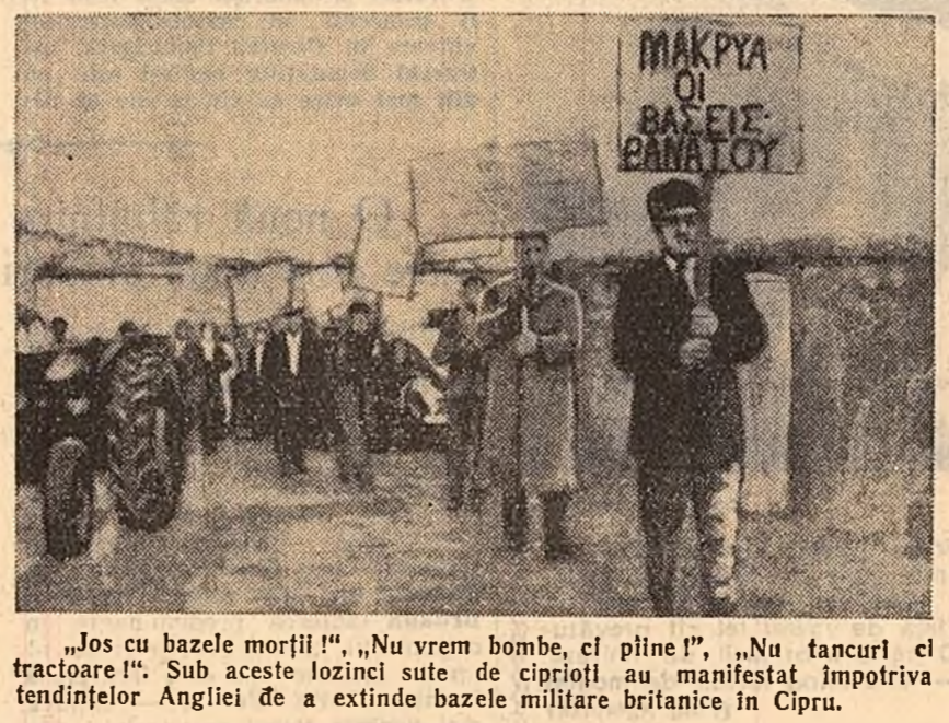
„Jos cu bazele morții!“, „Nu vrem bombe, ci pîine!“, „Nu tancuri ci tractoare!“

de țărani cultivatori au protestat împotriva prețului cartofilor, impus de monopolul, chestorii și-au părăsit repede fotelele pentru a prelua personal conducerea batolionelor, ca și cînd țara ar fi fost în pericol. Dar dacă un mare industriaș cunoscut fără urmă de rușine și otrăvit de numeroase persoane din dorința neobișnuită de cîștig, atunci chestorii cad în letargie. Și chiar dacă se deschide un proces, marele industriaș cîștigă pînă la urmă și trage la răspundere pe cine l-a denunțat. ...In dimineața zilei de 18 februarie, pe aeroportul din Djakarta a aterizat avionul pe bordul căruia au sosit în Indonezia N. S. Hrușciiov, președintele Consiliului de Miniștri al U.R.S.S., și persoanele care îl însoțesc. Aeroportul capitalei indoneziene era pavozat cu drapelul de stat ale U.R.S.S. și Republicii Indonezia. N. S. Hrușciiov a fost întâmpinat de Sukarno, președinte și prim-ministru al Republicii Indonezia, Djanda, ministru prim al Cabinetului de lucru, miniștri ai cabinetului, membri ai parlamentului, reprezentanți ai partidelor politice, ai vieții publice indoneziene, membri ai corpului diplomatic, de zeci de mii de locuitori ai Djarkarte. In cinstea sosirii înaltului oaspete sovietic s-au tras 21 lovituri de tun. Președintele Sukarno și N. S. Hrușciiov au rostit calde cuvîntări de salut.