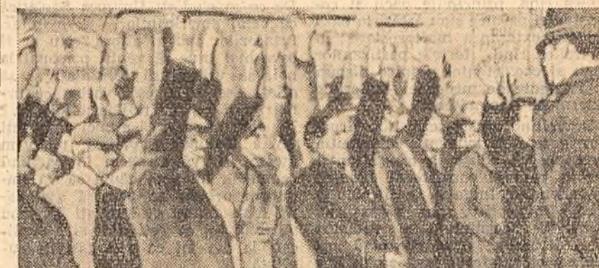
În cursul acestei luni membrii Sindicatului Național al feroviarilor britanici au desfășurat puternice acțiuni în sprijinul revendicării lor cu privire la mărirea salariilor. Iată un grup de muncitori feroviarilor la un miting din Trafalgar Square (Londra).

La 21 februarie la orele 10 dimineața s-a înregistrat un puternic cutremur în regiunea Molouza, situată la circa 200 km. sud-est de Alger. După datele preliminare s-a anunțat oficial că s-au înregistrat 44 de morți și un număr de aproximativ 90 de răniți.