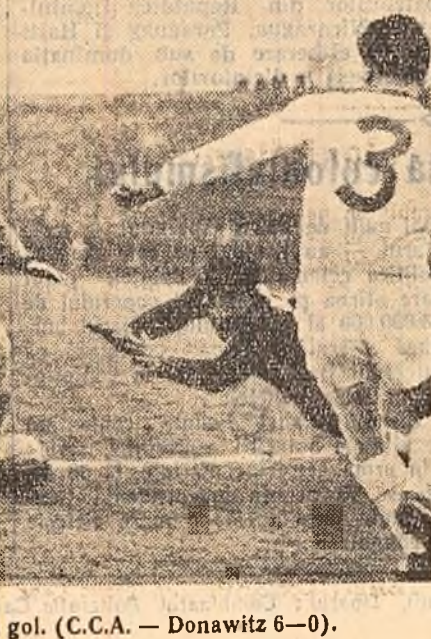
Un nou gol. (C.C.A. - Donawitz 6-0).

● Înaintea ultimelor două runde ale campionatului U.R.S.S. de salt în clăsimant conduce Gheller cu 12½ puncte, urmat de Korcinoi cu 12 puncte. ● Întrîntarea amicală de box dintre echipele cluburilor C.C.A. și Celta Bucur, s-a încheiat cu victoria pugiliștilor militari cu scorul de 14-6. ● Cu prilejul unui nou concurs de verificare al atleților americani selecționați în lotul olimpic, în sala Madison Square Garden din New York atletul negru John Thomas a realizat la săritura în înălțime 2,184 m (cea mai bună performanță mondială). ● La Sofia, echipa bulgară T.D.N.A., campioana țării, a învins cu scorul de 1-0 formația iugoslavă Dinamo Zagreb.