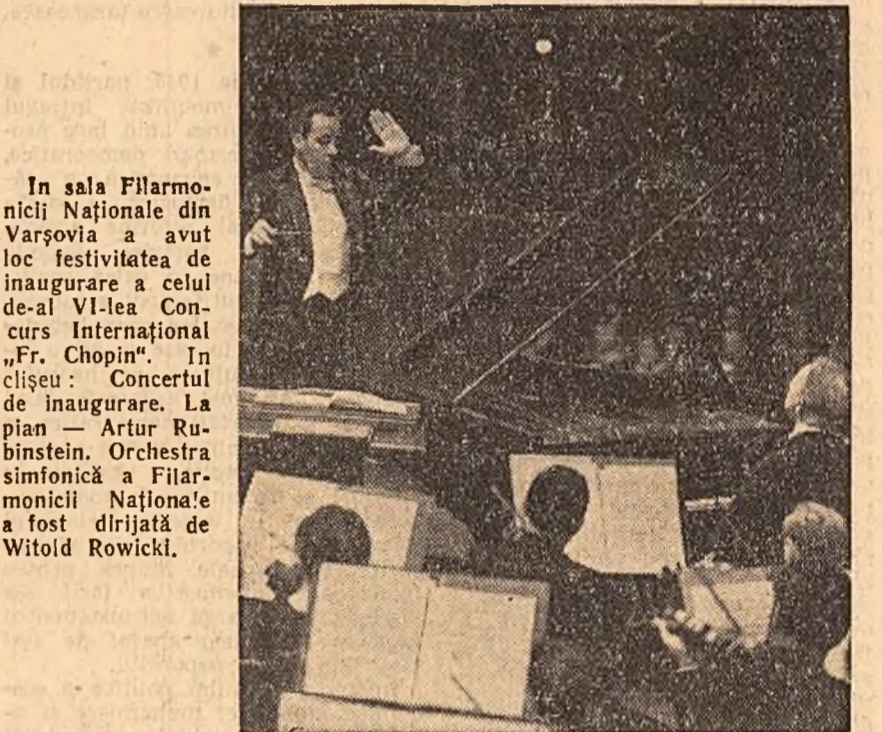
In sala Filarmonice Naționale din Varșovia a avut loc festivitatea de inaugurare a celui de-al VI-lea Concurs Internațional „Fr. Chopin”. În clădire: Concertul de inaugurare. La pian — Artur Schnabel. Orchestra simfonică a Filarmonice Naționale a fost dirijată de Witold Rowicki.