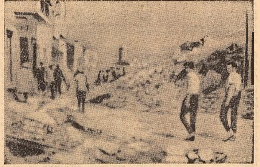
Orașul marocan Agadir, frumoasa stațiune climaterică pe litoralul Atlanticului, a încetat să mai existe, în urma puternicului cutremur din noaptea de 29 februarie spre 1 martie. Potrivit agenției France Presse, au pierit aproximativ 10.000 de persoane.