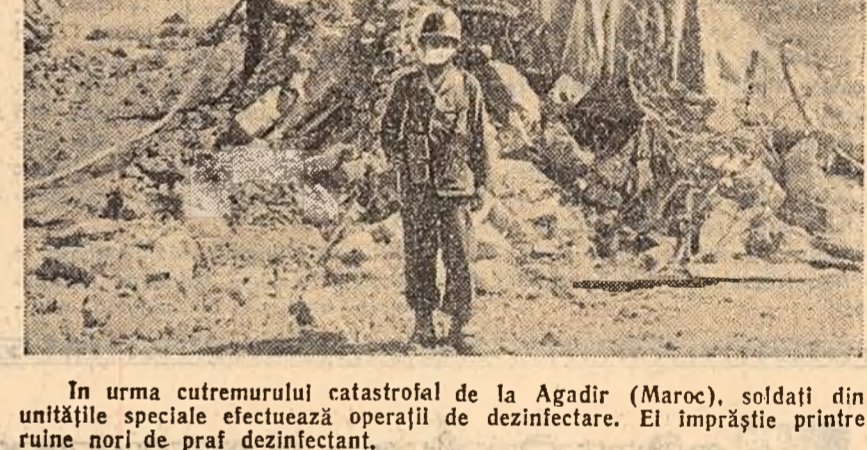
În urma cutremurului catastrofal de la Agadir (Maroc), soldații din unitățile speciale efectuează operații de dezinfectare. Ei împrăștie printre ruine nori de praf dezinfectant.