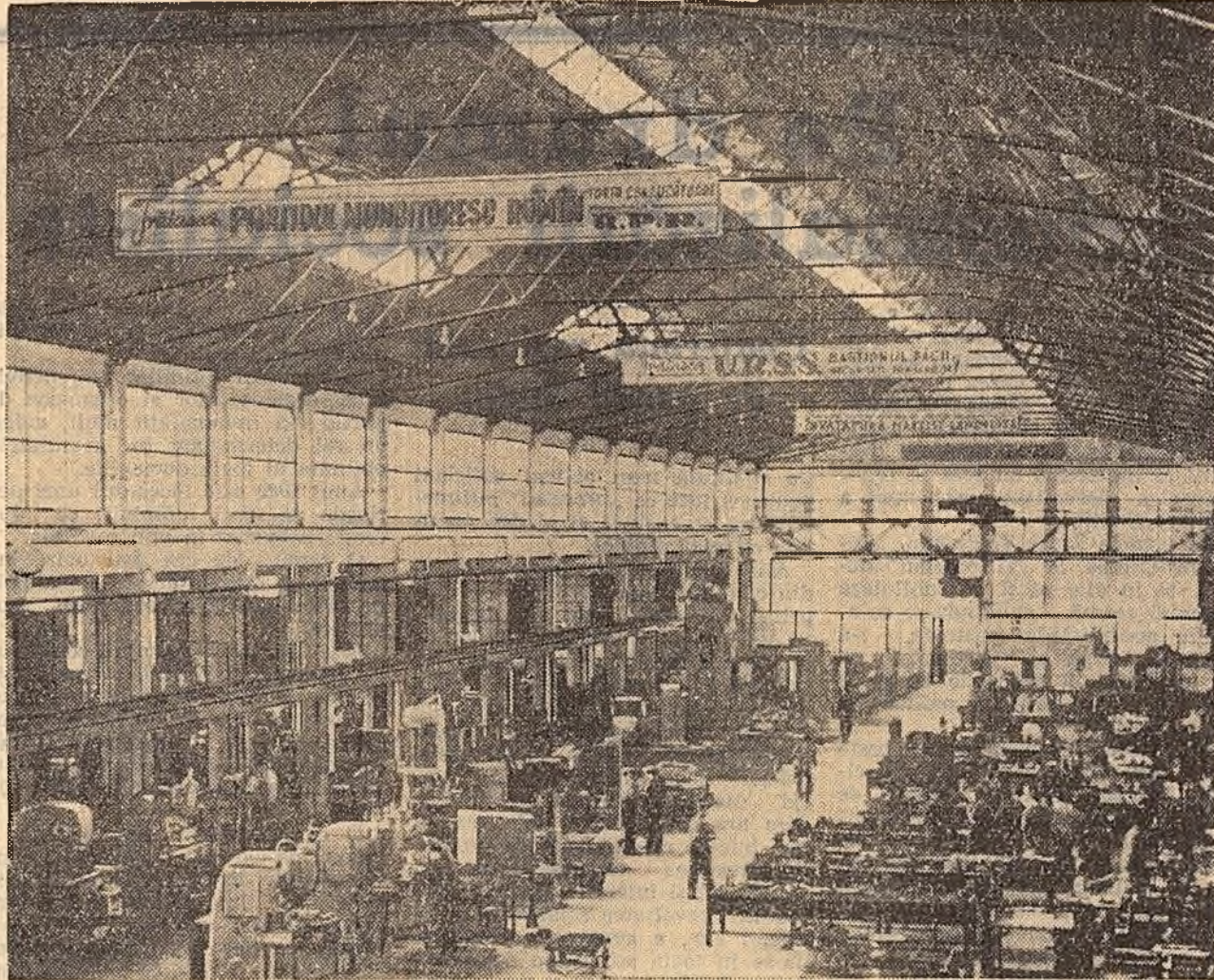
Aspect al halei noii sculării a uzinei „Steagul Roșu” — Orașul Stalin

E, în centrul Sîntanei, o construcție nouă, datînd din 1956: magazia de cereale a gospodăriei, cu o capacitate de sute de tone, în care încărcarea și descărcarea sint mecanizate. M-am urcat în acest siloz modern, aproape la fel de înalț cît o clopotniță, în care