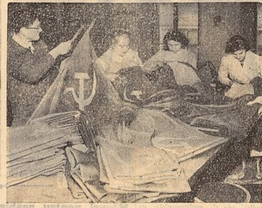
În preajma vizitei lui N. S. Hrușciov în Franța, atelierele specializate din Paris lucrează intens la confecționarea de drapele sovietice, cerute în număr mare atît de instituții cit și de către particulari. În fotografie: Aspect dintr-un atelier al unei fabrici din Paris unde se confecționează drapele sovietice.