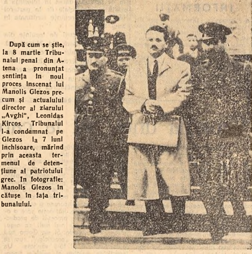
După cum se știe, la 8 martie Tribunalul penal din Atena a pronunțat sentința în noul proces înscenat lui Manolis Glezos precum și actualului director al ziarului „Avghi”, Leonidas Kircos. Tribunalul l-a condamnat pe Glezos la 7 luni închisoare, mărînd prin aceasta termenul de detențiune al patrioților grec. În fotografie: Manolis Glezos în căușe în fața tribunalului.