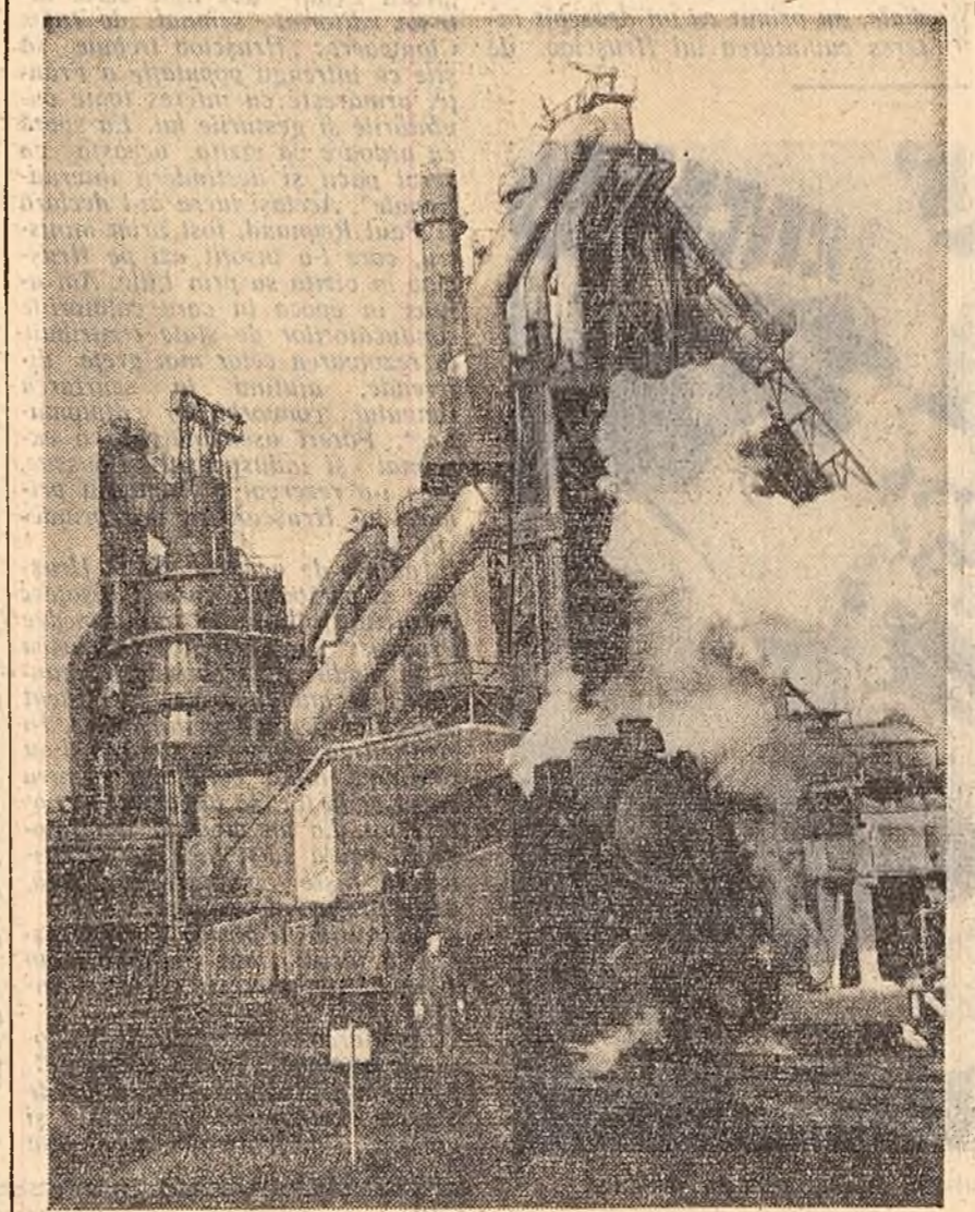
Vedere a furnalului Nr. IV de la combinatul metalurgic din Stallstadt (R. D. Germană).

Asadar alte și alte pagini se adaugă cazierului organizatorului de masacre Oberländer pe care guvernul de la Bonn nu numai că nu trimite pe banca acuzaților, ci îl menține într-un fotoliu ministerial.