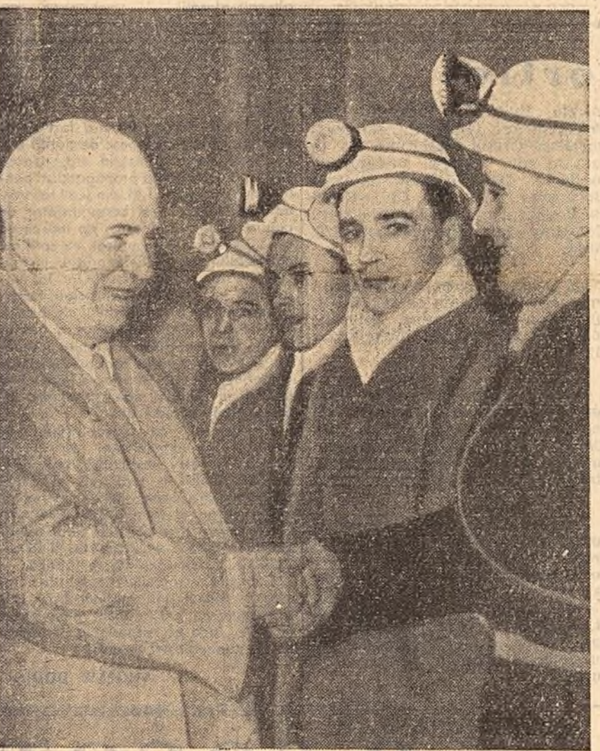
La Lille, în aclamațiile multîmii, N. S. Hrușciiov a strîns mîna celor 25 de mineri care formaseră o gardă de onoare.

— Cum te cheamă, a întrebat Hrușciiov pe unul din ei.