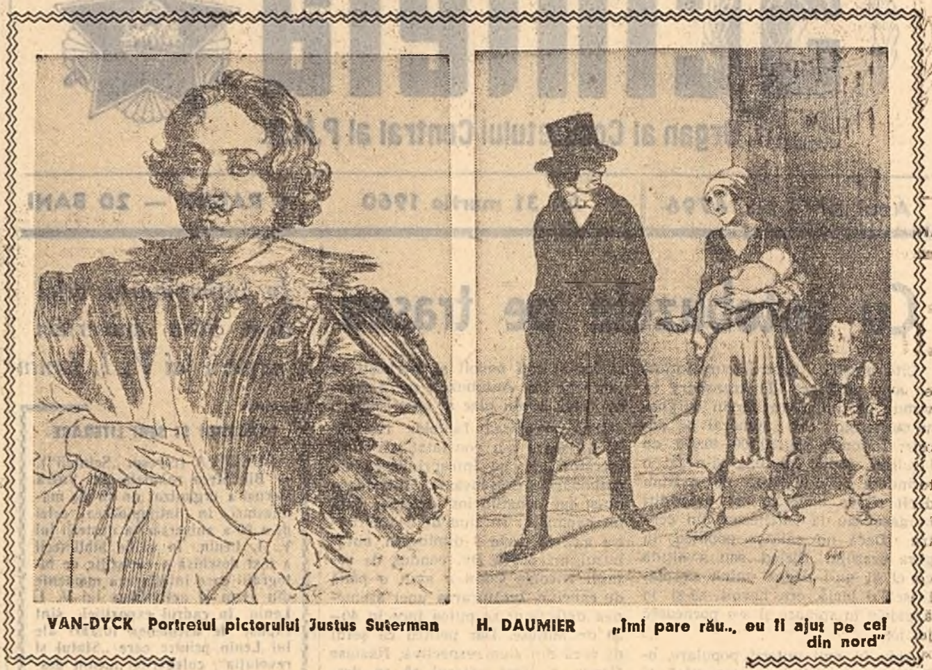
VAN-DYCK Portretul pictorului Justus Suterman H. DAUMIER „Imi pare rău... eu îi ajut pe cel din nord”