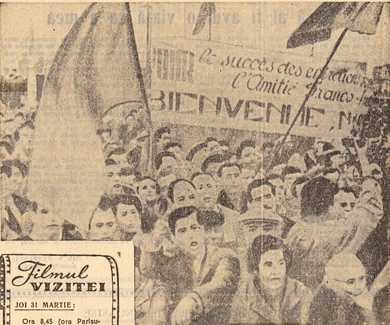
Locuitorii Marsiliei salută cu căldură pe N. S. Hrușciiov și urează succes convorbirilor franco-sovietice.