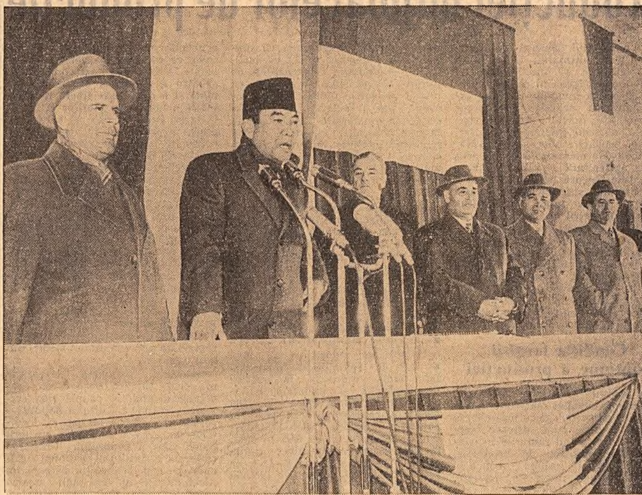
În tribuna oficială