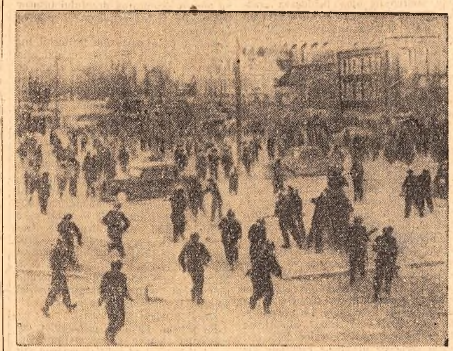
Sute de mii de țărani au participat la recente demonstrații de protest desfășurate în 17 localități din Franța. Ei au cerut îmbunătățirea condițiilor de trai.

DIJAKARTA 13 (Agerpres). — TASS: La 13 aprilie a avut loc la Djakarta semnarea contractelor în baza cărora organizațiile sovietice de comerț exterior vor livra Indoneziei utilaje și materiale de construcție și vor trimite specialiști pentru acordarea de ajutor tehnic în construirea unui nou stadion la Djakarta. La ceremonia semnării a luat cuvîntul Maladi, ministrul Informațiilor din Indonezie. Colaborarea dintre țările noastre, a spus Maladi, capătă forme tot mai concrete și acest lucru ne bucură foarte mult. Stadionul care se construiește la Djakarta va fi un monument al prieteniei și colaborării dintre popoarele sovietice și indoneziane.