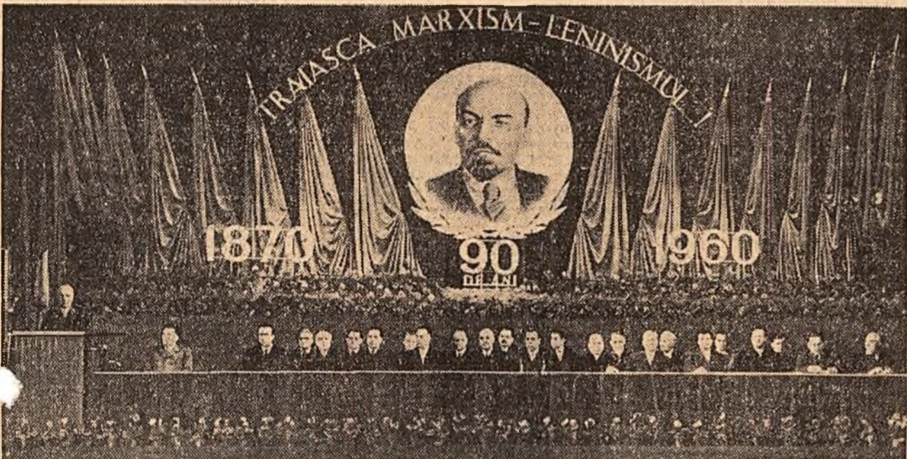
Prezidiul adunării solenne