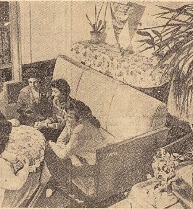
Bucuroase de oaspeți — în casă nouă! Studenții Universității „Babeș-Bolyai” din Cluj s-au mutat, de curînd, într-un cămin nou, al cărui hol îl vedeți în fotografie. 2.200 de studenți romîni, maghiari, germani, care învață la această universitate, locuiesc în cămine moderne, cu camere luminoase și confortabile.

Împărțiți pe secții, studenții au început prezentarea lucrărilor.