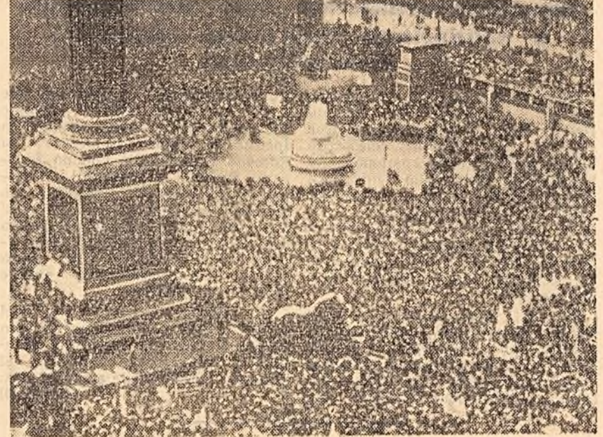
Un mars pentru pace fără egal în istoria Angliei! Plecînd de la Aldermaston, participanții erau în număr de 10.000 iar cînd au ajuns în piața Trafalgar din Londra erau 40.000. Mășturătorii s-au adunat într-un uriaș miting în piața Trafalgar unde au afirmat cu putere dorința de pace și dezarmare a poporului englez.