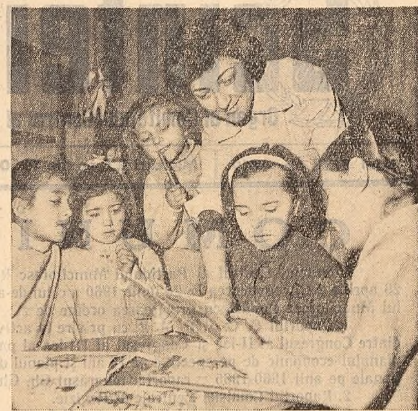
Primii pași în lumea cărților. La Biblioteca centrală de stat din Capitală, filiale pentru copii.

Așa am lucrat pentru realizarea sarcinilor date de biroul Comitetului orașenească. Vreau să spun încă un lucru. Mă feresc să fac o muncă în asalt, pe apucate. Fac tot ce-i posibil să am continuată în muncă, astfel ca să se obțină rezultate. Dar din păcate nu am reușit să-mi formez un asemenea stil de muncă care să-mi permită să ajut toate organizațiile de bază. Am o bună continuitate în munca de îndrumare a organizațiilor de bază de la Depoul C.F.R.-Timiș Tria, de la atelierul de automobile C.E.R. Sînt însă organizator intern, de care răspund, destul de multe la număr, la care nu am fost de multă vreme. Și asta din cauză că sînt reținut prea mult în birou cu pregătirea unor referate, organizarea de ședințe etc. Știu că acesta nu e un stil bun de muncă. Preocuparea noastră se îndreaptă spre a reduce din timpul de lucru în birou și o soluție n-am găsit încă. Sînt însă centre industriale la fel de dezvoltate ca și în orașul nostru. Aș vrea să aflu, bunăoară, cum își organizează munca, cum lucrează cu organizațiile de bază, secretarii Comitetelor orașenești de partid Timișoara, Reșița, Hunedoara.