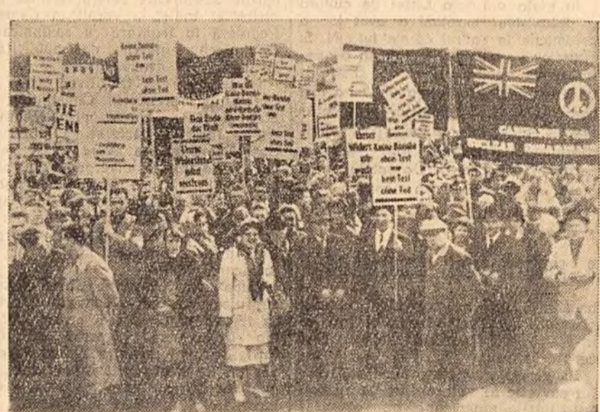
Plecînd din Hamburg, participanții la marșul de protest împotriva înzestrării Bundeswehrului cu arme atomice a ajuns la Bergen-Holne, în apropierea cărui se află rampa pentru lansarea de rachete a N.A.T.O. Mii de persoane au întîmpinat cu căldură pe participanții la marș.

WASHINGTON 26 (Agerpres). - La 25 aprilie Ministerul Muncii al S.U.A. a anunțat că în luna martie indicele costului vieții în Statele Unite a atins un „nivel record” de 125,7 la sută față de media prețurilor din anii 1947-1949.