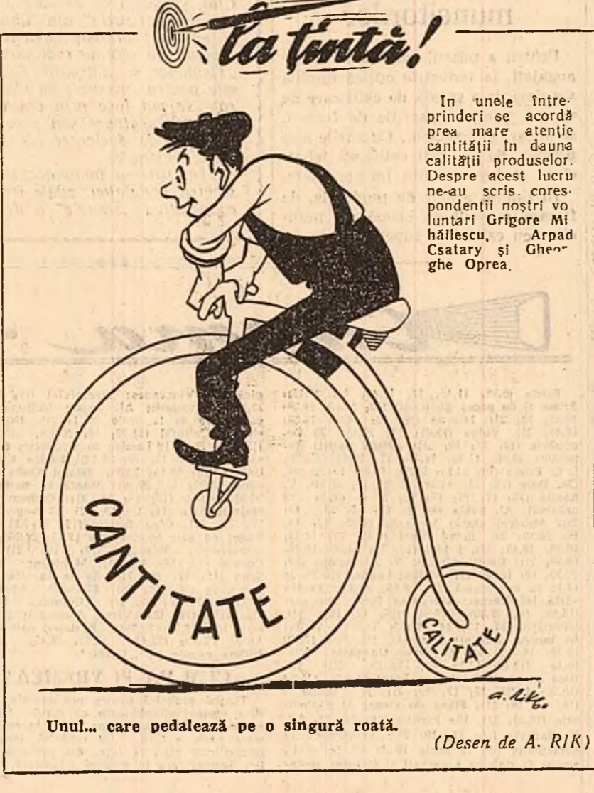
Unul... care pedalează pe o singură roată.