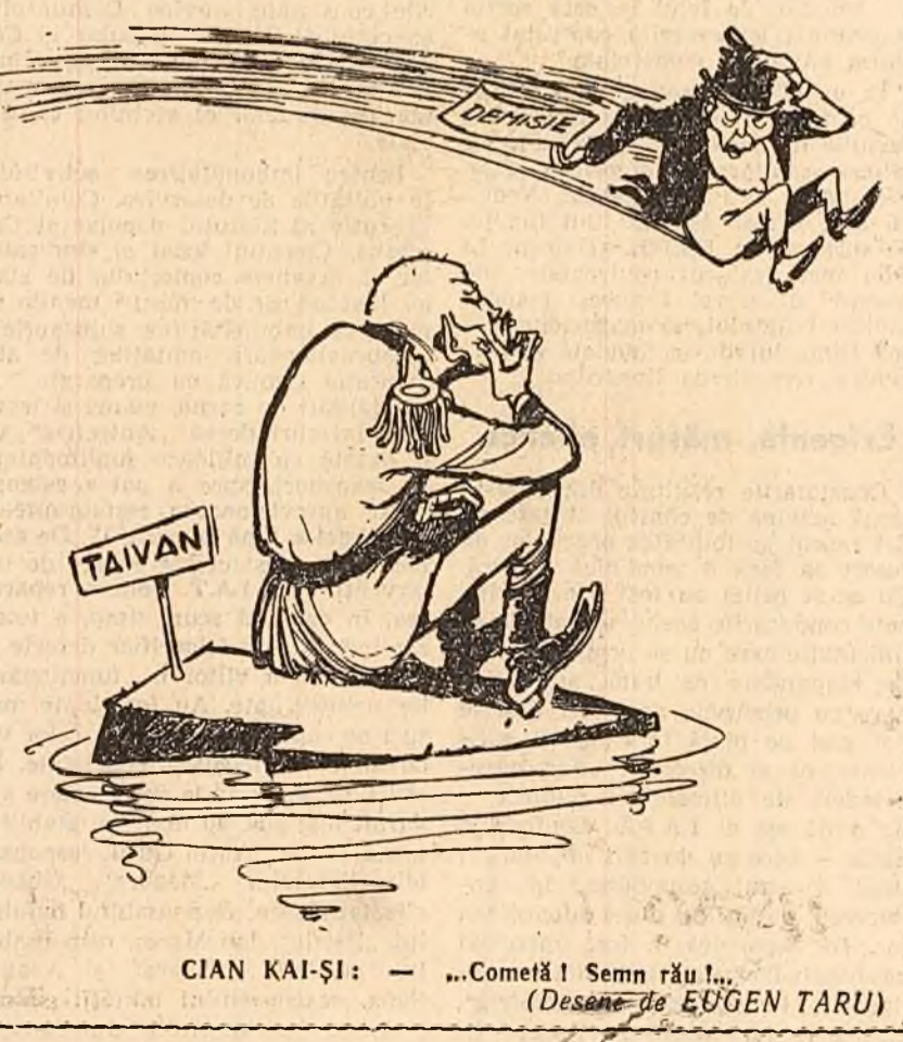
CIAN KAI-ȘI: — „Cometă! Semn rău!... (Desene de EUGEN TARU)