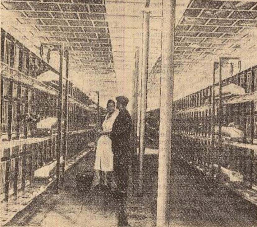
Ferma de stat Stadice (R. Cehoslovacă) are un mare număr de păsări de la care obține 1 milion de ouă pe an. În fotografie: Vedere dintr-o încăpere a fermei de păsări.

3.000. Numai la 27 aprilie, în urma noilor razii de masă în suburbiile africane ale orașelor Johannesburg și Capetown poliția și trupele au arestat încă 638 africani.