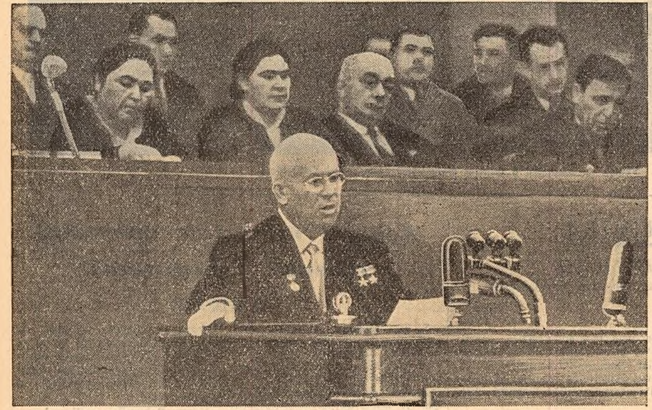
N. S. Hrușcirov vorbind la sesiunea Sovietului Suprem al U.R.S.S.

Devenind pentru prima oară stăpîn pe soarta sa, poporul țării noastre își consacră toate forțele construirii vieții noi, socialiste. Oamenii muncii din R. P. Romînă, apără ca lumina ochilor independența națională, rod a sute și sute de ani de luptă eroică, plină de sacrificii; ei sînt conștienți de faptul că alianța și colaborarea frățoasă cu țările lagărului socialist în frunte cu Uniunea Sovietică este cheazășia consolidării continue a independenței naționale și a construcției victorioase a socialismului. Strîns unit în jurul partidului și guvernului, înapînind cu entuziasm politica leninistă a partidului, conducătorul său încercat, poporul romîn dă astăzi viață visului a zece generații de luptători pentru înflorirea patriei.