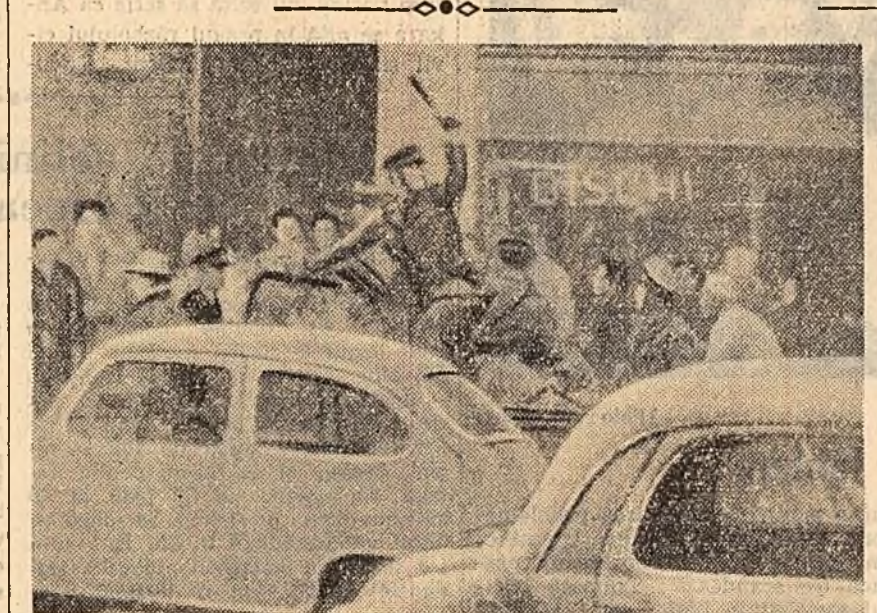
Poliștii din Bologna, reprimind pe participanții la mitingul de protest împotriva folosirii bazelor S.U.A. din Italia în scopuri de spionaj.

In ultimul timp au fost prezentate ambasadei americane cereri similare de către numeroase organizații de femei, sindicale, de tineret și altele.