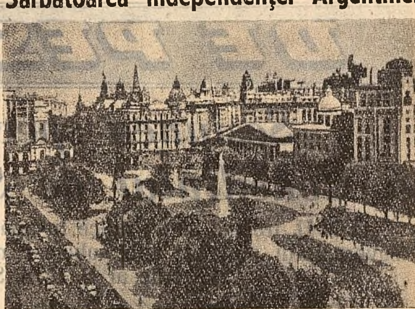
Vedere din orașul Buenos Aires, capitala Argentinei.

Astăzi este sărbătoarea națională a poporului argentinian. Acum 150 de ani, a avut loc în Argentina revoluția din mai 1810, care a marcat începutul luptei poporului împotriva dominației spaniole, pentru independența națională.