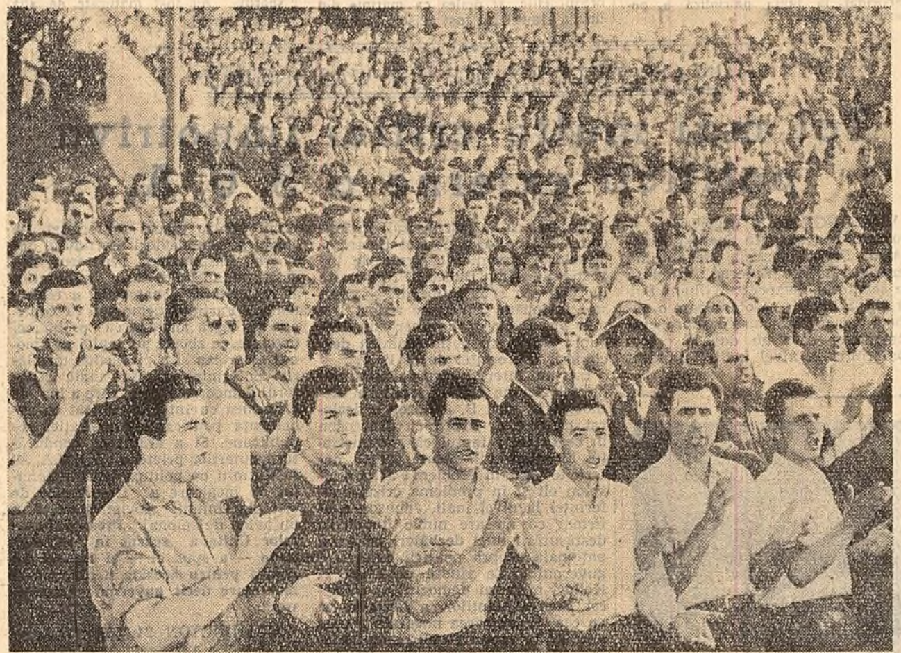
Aspect de la mitingul tinerilor din Capitală.