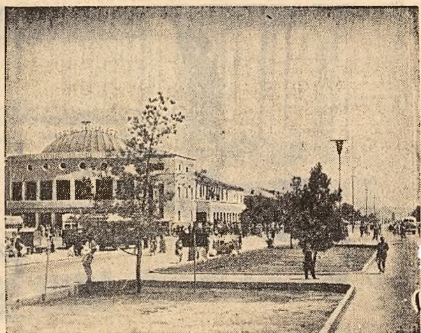
Astăzi poporul afgan sărbătorește Ziua Independenței țării sale — Împlinirea a 41 de ani de existență a Afganistanului ca stat independent. În fotografie: Aspect din orașul Kabul, capitala Afganistanului.

MOSCOVA 26 (Agerpres). — TASS: La Moscova a fost dată publicității telegrama adresată de președintele Consiliului de Miniștri al U.R.S.S., Nikita Hrușciov, premierului Consiliului de Stat al R.P. Chineze, Ciu En-lai, ca răspuns la telegrama de felicitare primită cu prilejul lansării de către Uniunea Sovietică a navei cosmice-satelit. În telegramă se spune printre altele: