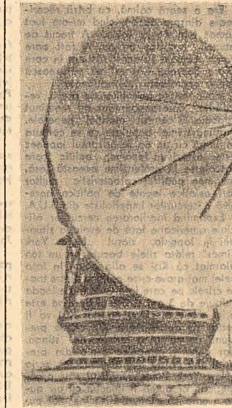
Acest radiotelescop parabolic cu diametrul de 22 de metri — care se află la o stație de radioastronomie din apropierea Moscovei — recepționează radiosemnalele venite din adîncul spațiului cosmic. Cu ajutorul unor mașini speciale de calcul, operatorul poate așeza radiotelescopul în așa fel, încît acesta să se miste slingur în direcția punctului pe care-l are sub observație. Acest radiotelescop este cel mai bun din lume în ceea ce privește precizia cu care a fost construită ogînda sa parabolică.

Dintre cele 527 modele de tractoare, mașini și unelte agricole, 150 sînt expuse pentru prima oară. Expoziția tematică „Urbanistica” ilustrează marea amploare a construcției de locuințe în U.R.S.S. În acest an în orașe și așezările muncitorești din țară se construiesc dînci apartamente pe minut.